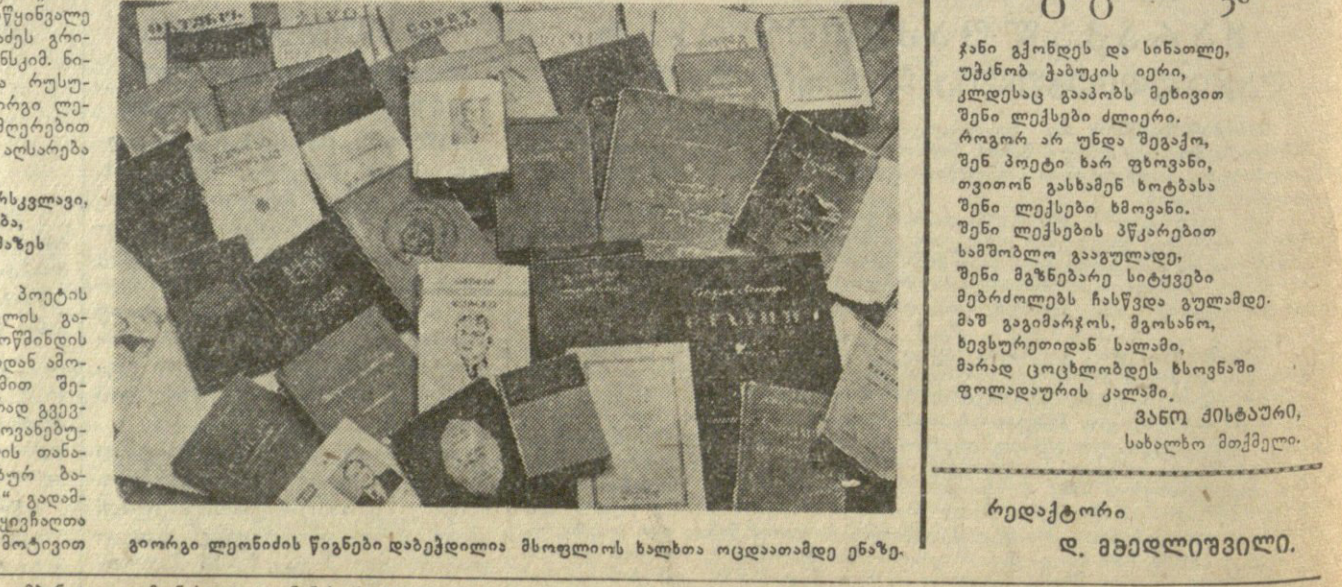
გიორგი ლომიძის წიგნი დაბეჭდილია მსოფლიოს ხალხთა ოცდაათამდე ენაზე.

სიმონ ჩიქოვანი ერთ-ერთი უდიდესი ქართველი მწერალია. მისი ნაწარმოებები მრავალხარისხიანია და მისი ნაწარმოებები მრავალხარისხიანია. სიმონ ჩიქოვანი ერთ-ერთი უდიდესი ქართველი მწერალია. მისი ნაწარმოებები მრავალხარისხიანია და მისი ნაწარმოებები მრავალხარისხიანია.