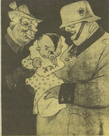
ნიოფაშისტები ახალ ჰიტლერს ჭრდნან!..

ბენტგონს, ამერიკის შეერთებული შტატების ადმინისტრაციასა და ნატოს მესვეურთ ჰგონიათ,