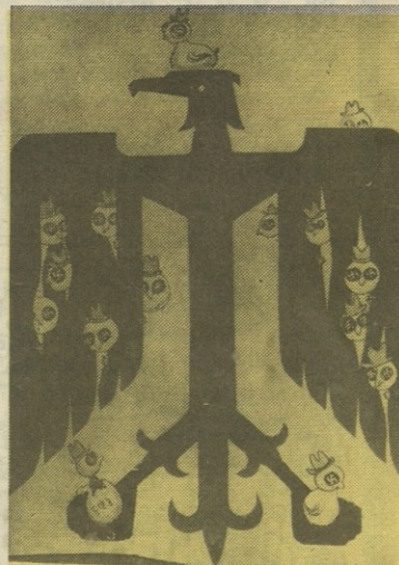
დასავლეთ გერმანიაში იჩეკება ნაცისტური ბარტყები