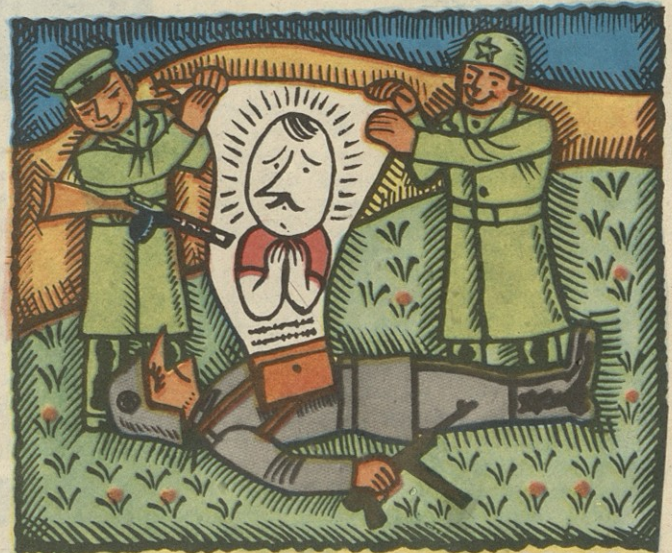
ილუსტრაციები დ. ზარაფიშვილისა .

ქართული საფრონტო გაზეთის „ყირიმის საბრძოლოს“ ყოფილი მუშაკი.