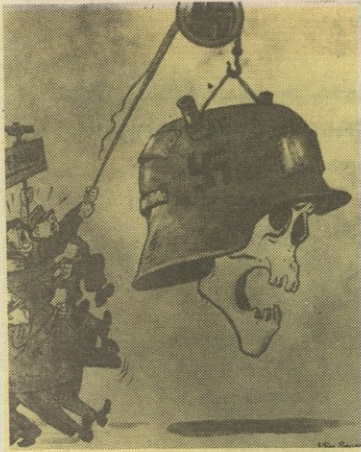
რევანშისტები შურნალი „პ რ ო კ ო დ ი ლ ი“

ციებ-ცხელება შეეყრება მსოფლიოში ყველაზე ლამაზი მეტროს მგზავრებს (მხედველობაშია მოსკოვის მეტრო), ვერავინ ვერ გაიგებს, ვინ იყო ამაში დამნაშავე“.