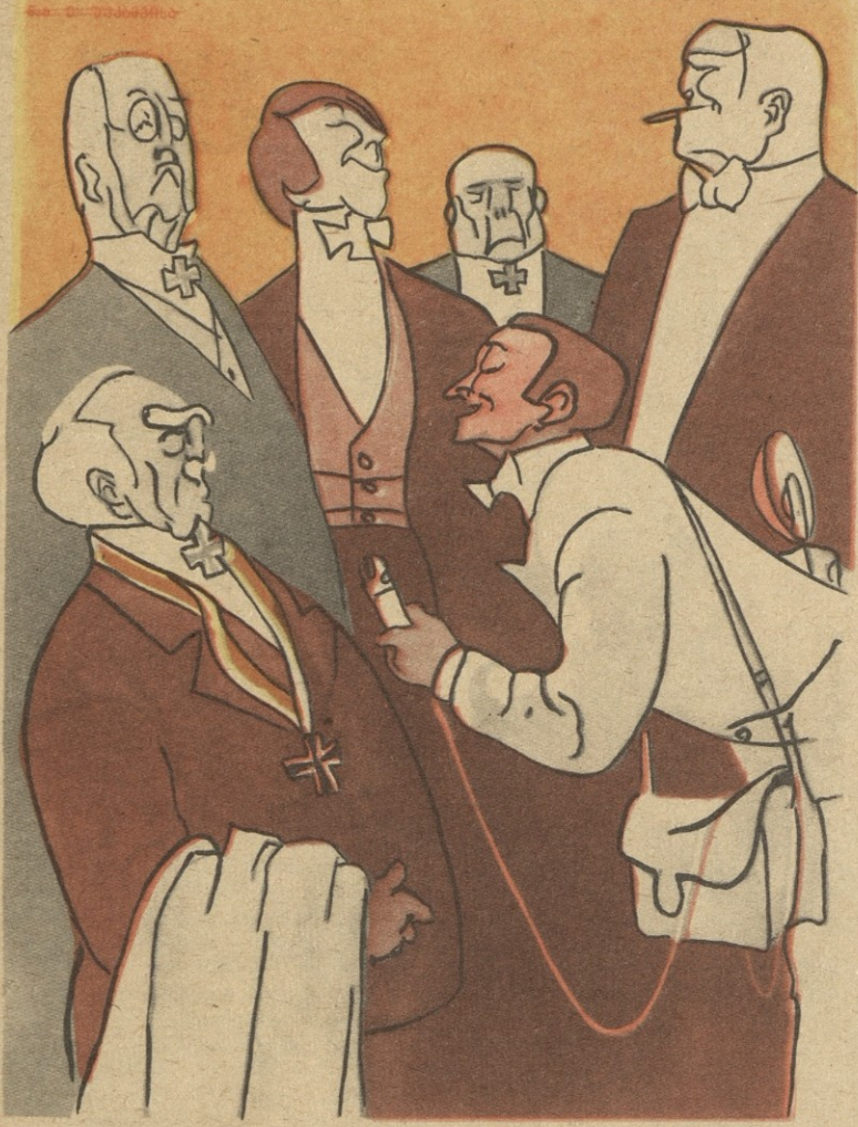
— ამბობენ, ნაციონალ-დემოკრატიულ პარტიაში ბევრი ძველი ნაცისტიაო... — ცილისწამებაა, ბატონებო! ძველი რად გვინდა, ჩვენ ახლებიც გვეოფნის! ურუნალი „პ რ ო კ ო დ ი ლ ი“