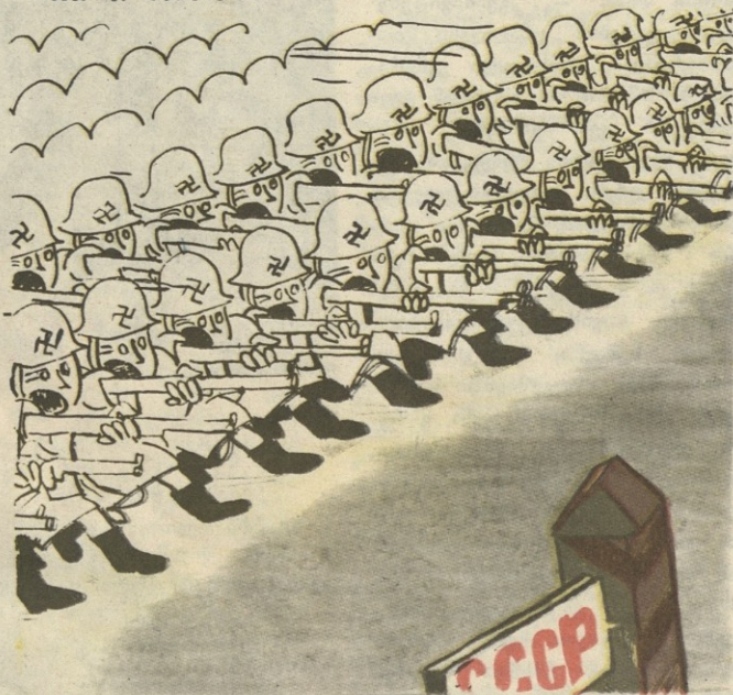
ნახ. მ. აბაშიძისა