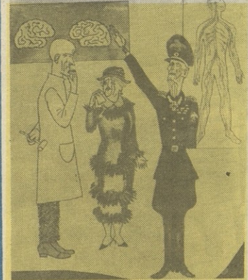
— გვიშველეთ, ექიმო! ისე განვიფაროდა სკლეროზი, რომ სულ არ ახსოვს, რა დღე აყარეს მეორე მსოფლიო ომში! შურნალი „ნი ა ნ გ ი“

ძნელია, ეჭვი შეგეპაროს ამ საშინელების სისწორეში, რადგან მარტო მისი წაკითხვითაც კი ეწყება კაცს გულის რევა. ამინდის შეცვლასაც კი ცდილობენ სამტროდ მესამე მსოფლიო ომის მესვეურები, რომელნიც, სამწუხაროდ ამინდს ქმნიან კაპიტალის სამყაროში!