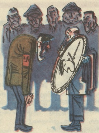
ორიოდე სიტყვა ვეჟარაჟის აპტორზე

რაინსპარიკმანერი ფრიდრის შვიდის ვეჟარაჟი