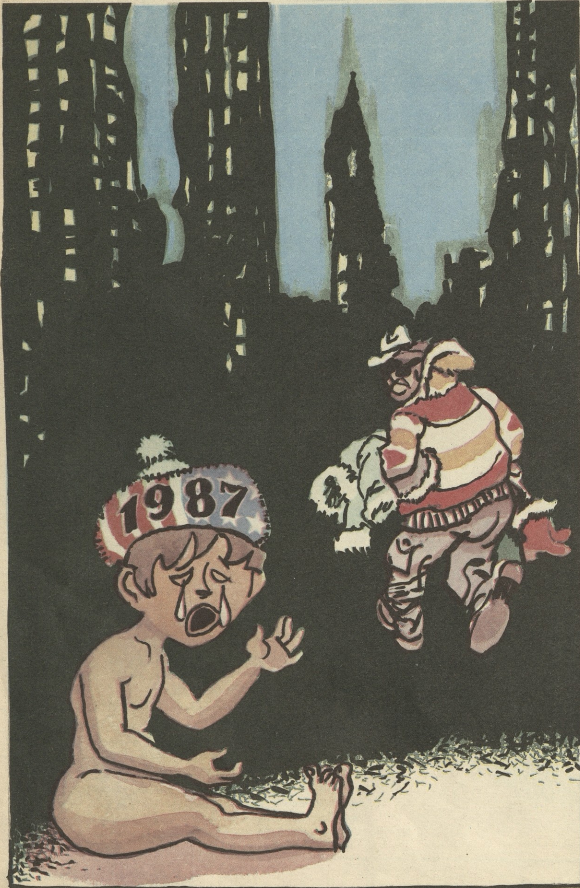
ახალი წელიც ერთ წაშში გაძარცვას!