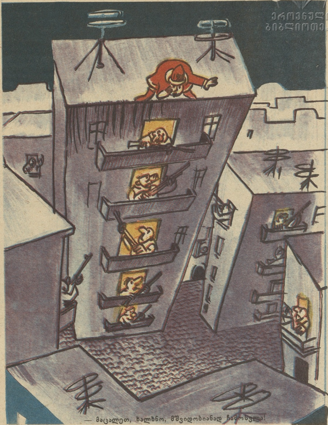
— მაცალეთ, ხალხნო, მშვიდობიანად ჩამოსვლა!