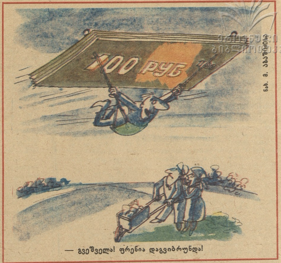
— გვეშველა! ფრენია დაგვიბრუნდა!

დაბლიდან ძახილი ისმის: — ქართველებო, გამოგვხედეთ!