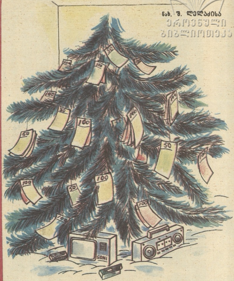
ანტიბოდის ნადვის ხე