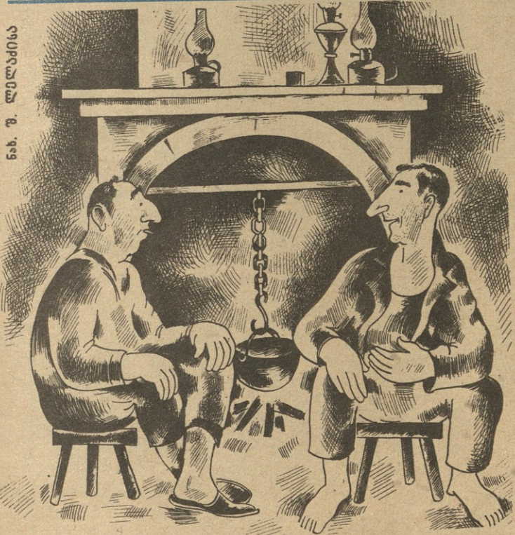
ნახ. შ. ლელაძისა