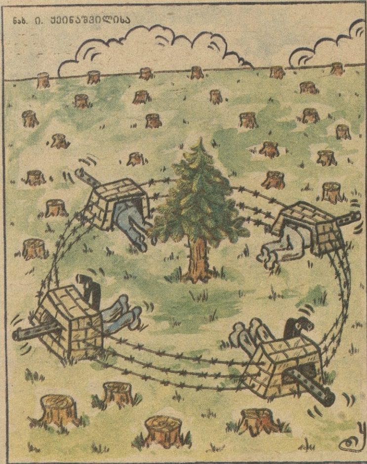
ნახ. ი. ქვიცაშვილისა