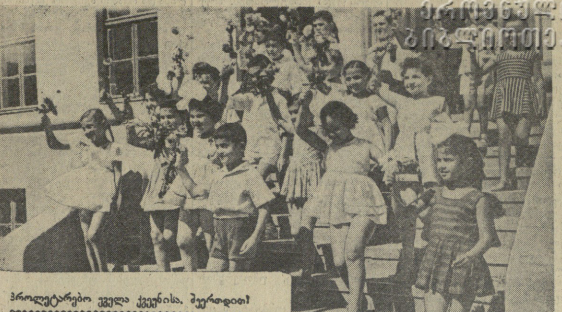
პროლეტარები ევლან კვირისა, შერადიტი