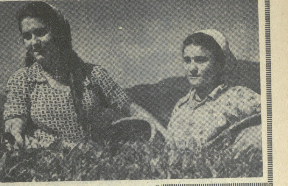
სასახლო შრომის გმირი, სოციალისტური შრომის გმირი.