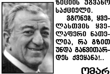
გმონოს, ყველასთვის ყველაფერი ნათელია, რა გმით უნდა განვიხილოთ და მისი მარგველაშვილი

დროა, ქართველო ხალხო, ჩვენი შორსმგზავალი, მხარდაჭერა ხელისუფლების რჩევებზე ვინაშით და ქვეყნის განვითარებაში. ამაზე მთავრად თანდას კავის ამტორისთვის საქართველოს სასამართლოს გადაწყვეტილება და მის ფორმა, რადიკალური ოპოზიციის უკანო საქმიანობა.