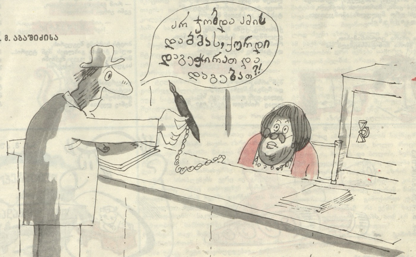
ნახ. მ. აბაშიძისა