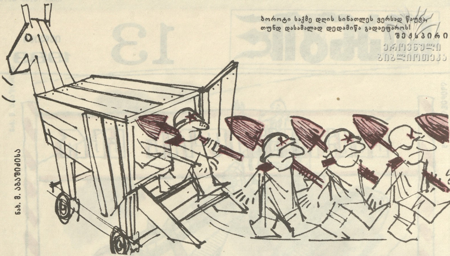
ნ. მ. კობახიძისა