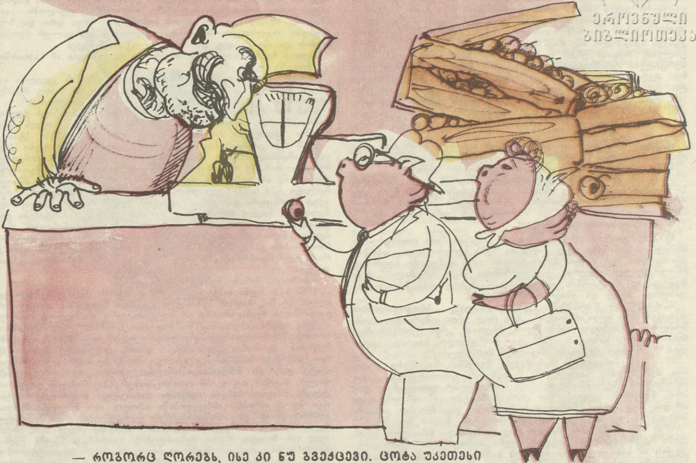
— როგორც ღორავს, ისე კი ნუ გვამცხვნი. ცოტა უკეთესი ამოგვირჩევი!