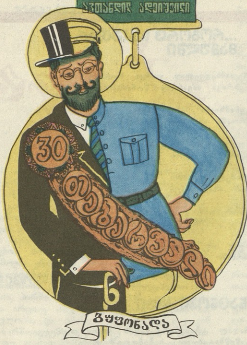
სახ. ე. ლომიძისა

ფსევდონოს ცოლი: ისე, კაცმა რომ თქვას, ჩემი ქმრის სახელის მინიჭება თვითმფრინავისათვის უფრო უპირანი იქნებოდა, რაც არ უნდა იყოს, მაინც პაერში დაიკარგა.