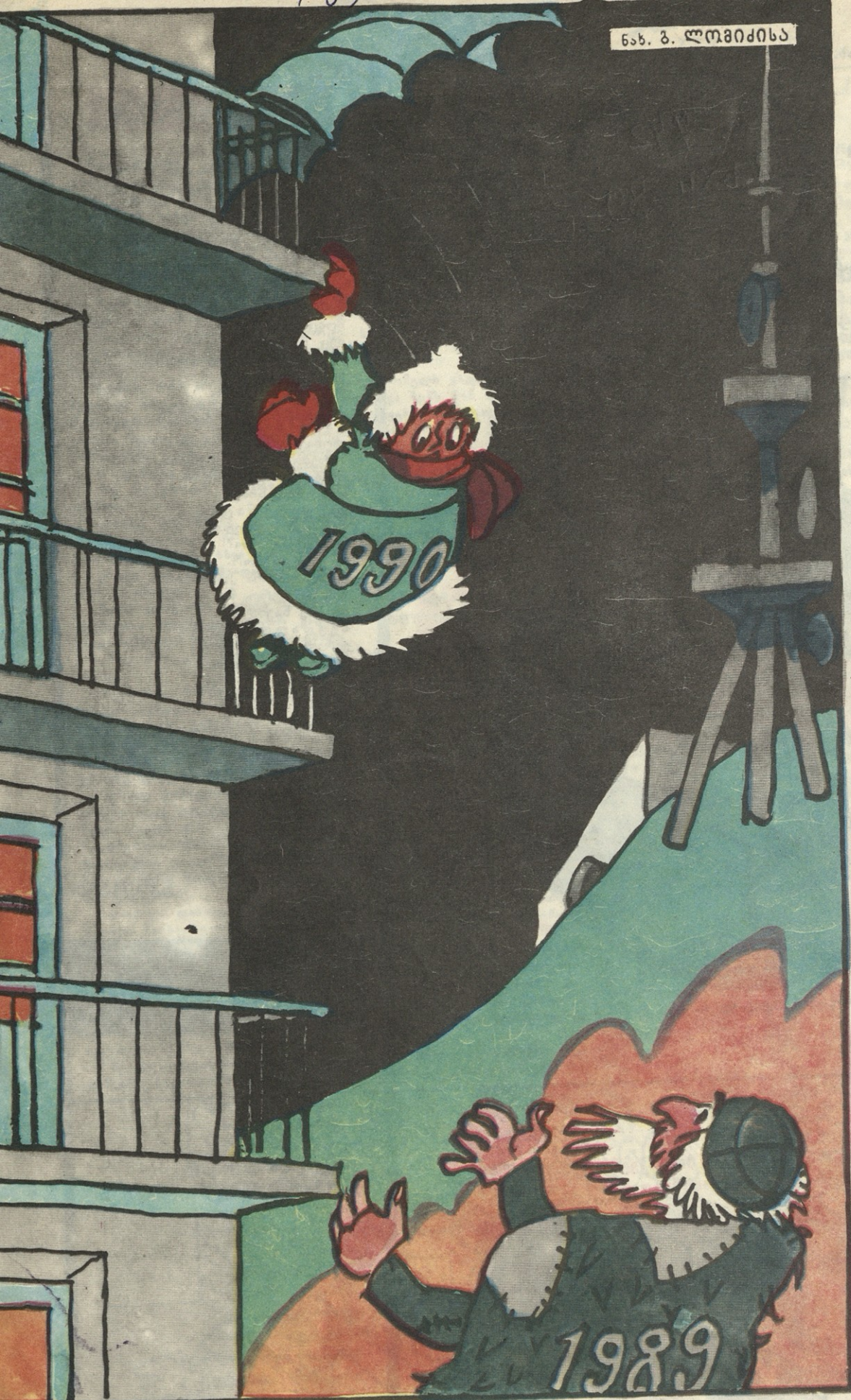
— რაღას ელოდები?! ჩამოდი!.. — მანდ ისეთი ამაზებია, მეშინია, რაზე არ შემამთხვიონ!