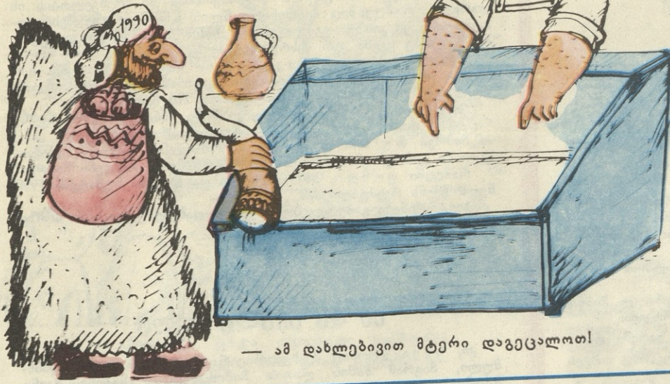
— ამ დახლებივით მტერი დაგეცალოთ!