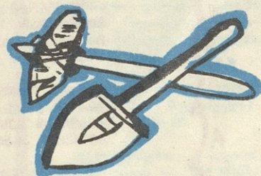
ნახ. 3. კუტიასი