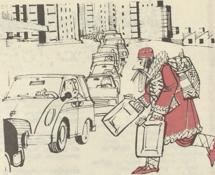
— ურიგოდ უნდა ჩამისხათ, ნაძვის ხეს- თან ბავშვები მელოდებიან!