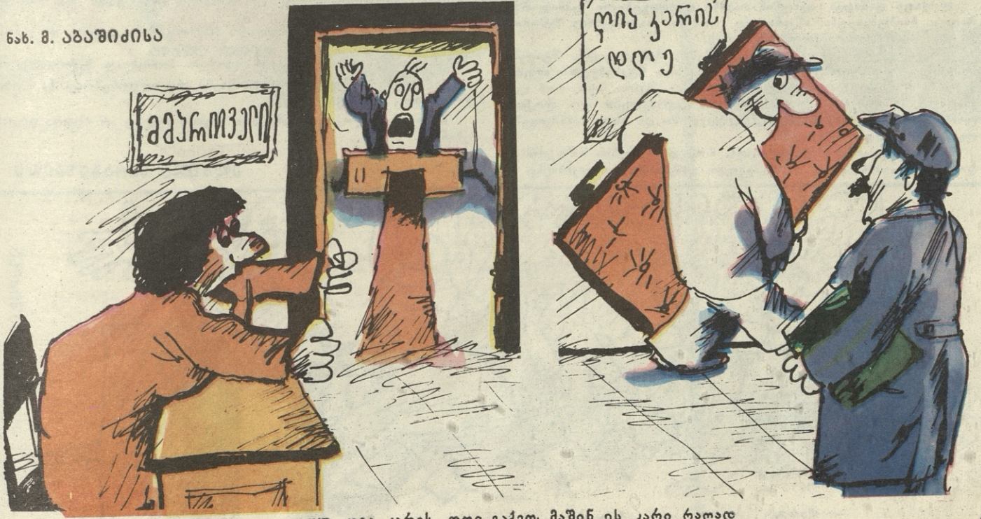
— თუ ღია კარის დღე გაქვთ, მაშინ ეს კარი რაღად გინდათ?!