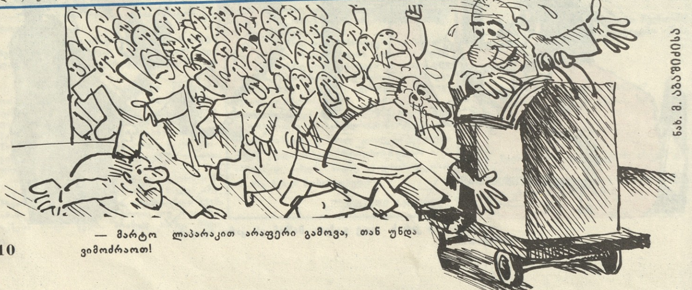
— მარტო ლაპარაკით არაფერი გამოვა, თან უნდა ვიმობრაოთ!