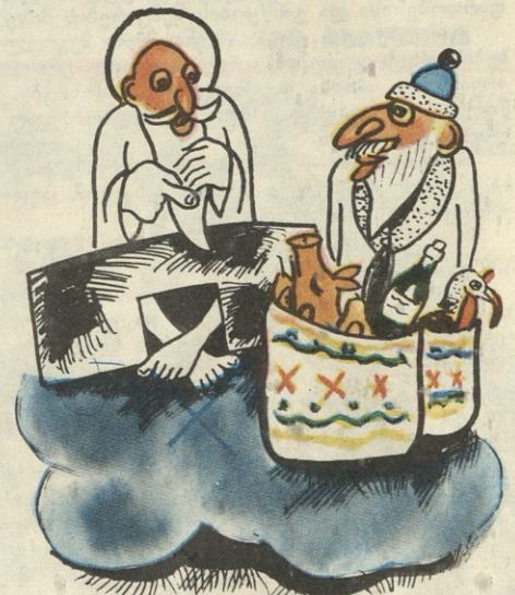
— მაგ საჩუქრებს ჩემი ფონდიდან საპო- ნიც დაუმატე!