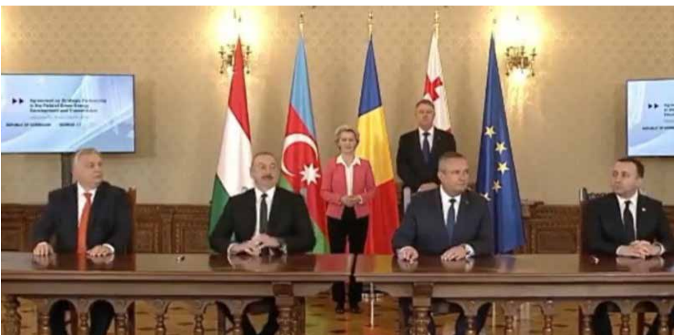
ევროპა სამხრეთ კავკასიის რეგიონს შავი ზღვის წყალქვეშა ელექტროკაბელის პროექტით დაუკავშირდება

„ამ პროექტის განხორციელების შედეგად, საქართველოს, რუმინეთის, აზერბაიჯანისა და უნგრეთის ელექტროგადამცემი ხაზებისა და სისტემების დაკავშირებით, ევროპა შეძლებს არა მხოლოდ საქართველოს, არამედ, მთელი სამხრეთ კავკასიის რეგიონს დაუკავშირდეს. 2020 წლის ივნისში, შავი ზღვის წყალქვეშა კაბელის წინასწარი ეკონომიკური ანალიზის საფუძველზე, მსოფლიო ბანკმა გამოაქვეყნა ანგარიში, რომლითაც დადასტურდა ამ პროექტის ეკონომიკური მიზანშეწონილობა. საქართველოს მთავრობამ, 2021 წლის 26 აპრილს, გამოაცხადა კონკურსი შავი ზღვის წყალქვეშა ელექტროკაბელისა და ციფრული