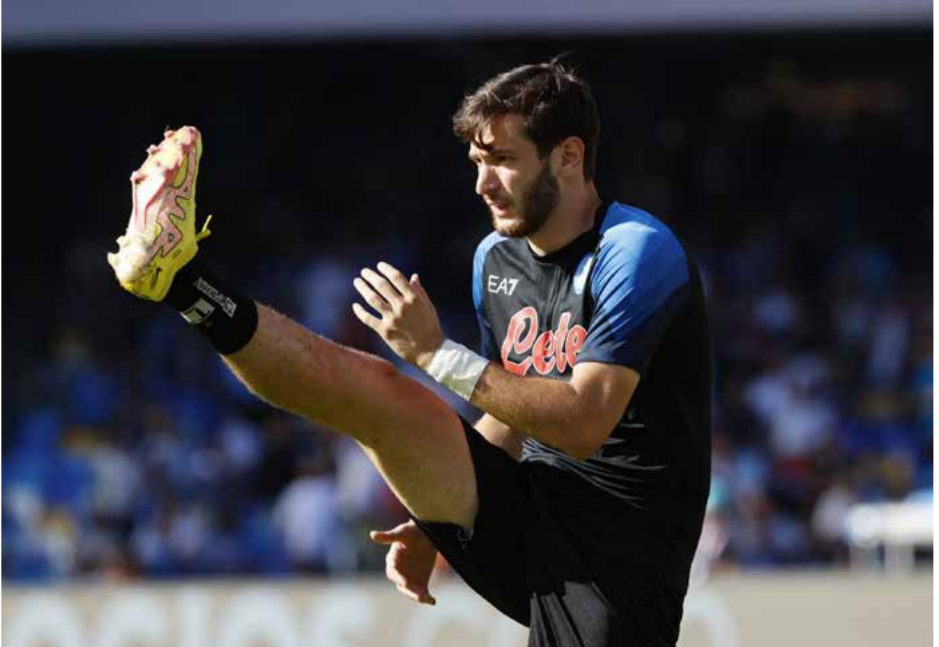
წინადადებას მიიღებს, თუმცა მთავარი კონტრაქტის – ქართველის გამოსასყიდი ფასი დღეს არსებული 30 პირობებში კიდევ ერთი პუნქტის ჩასწორება იქნება მილიონის ნაცვლად, 100 მილიონი ევრო იქნება.

იტალიური მედია კი წერს, რომ იანვარში ქართველი შემტევი „ნაპოლისგან“ კონტრაქტის გახანგრძლივებისა და ხელფასის გაორმაგების თაობაზე, ახალ