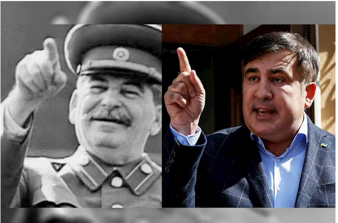
რატომაა რიცხვი 21 საქართველოსთვის საკრალური

უნიჭობას ვერც საქართველოს პრეზიდენტყოფილს დავნამებთ. ახლა, მიხეილ სააკაშვილი, შეიძლება, სტალინისდარი გენია არაა, მაგრამ თანამედროვე პოლიტიკის ვარსკვლავია. ვარსკვლავი, რომელიც კი არ ანათებს, არამედ, წვავს!