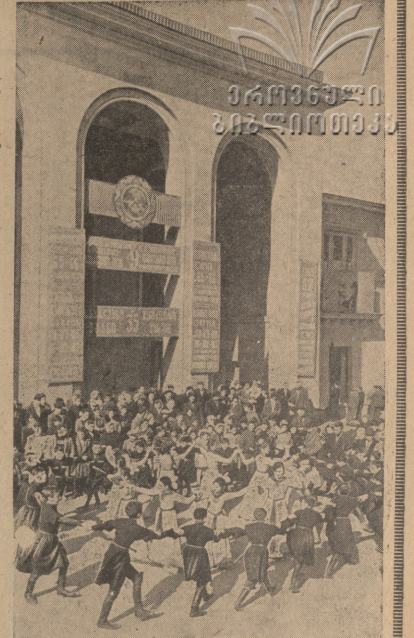
თბილისის ლენინის რაიონის 85 საარჩევნო უბანი, სახალხო ბლოკი.

წარმატებას გისურვებთ, ძვირფასო ახსნაგაბავო, ხალხის ღირსი ნდობის გამართლებათ!