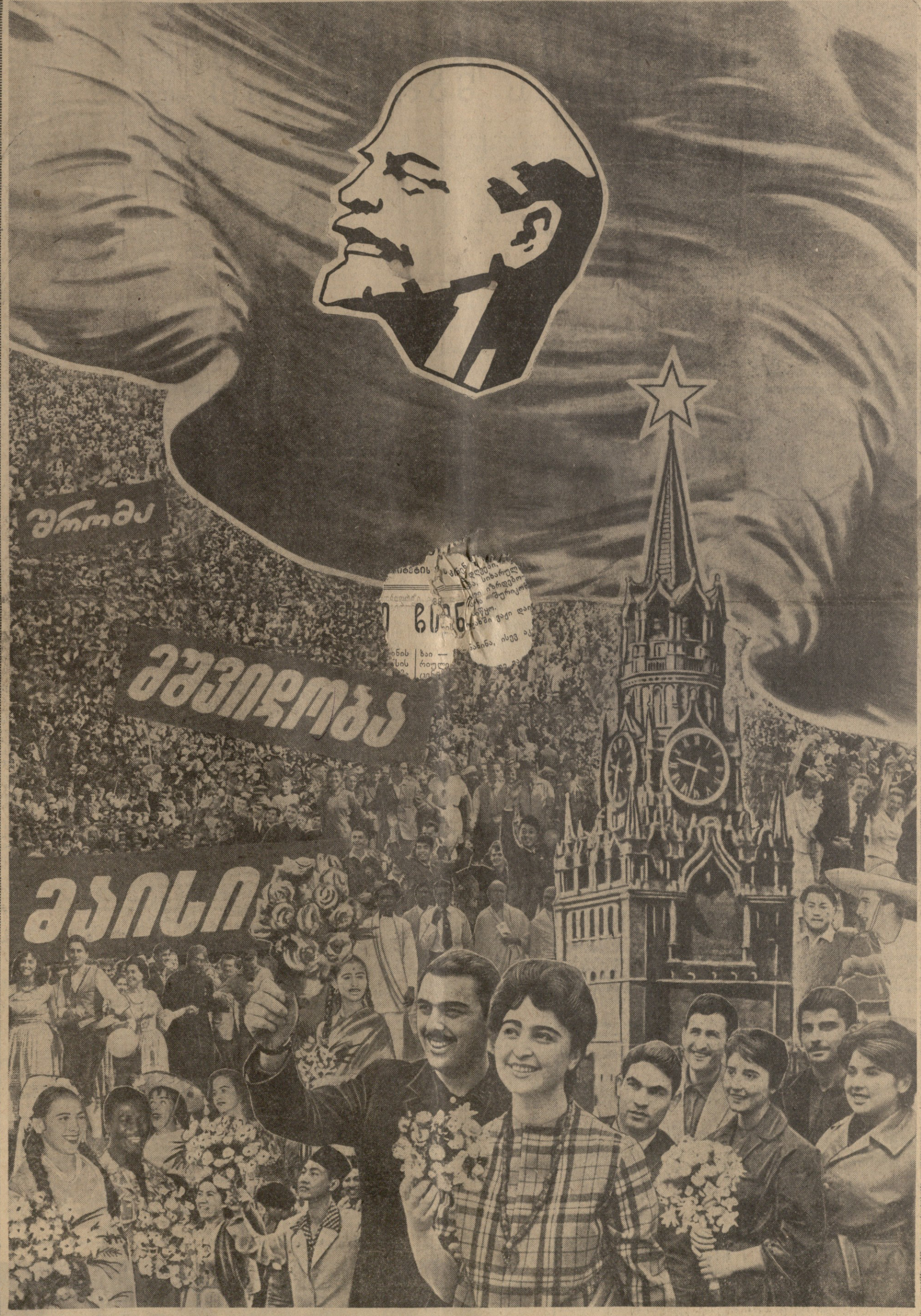
ფოტოლაკატი ი. პალკინსა და ვლ. ბინზაურისა.

მოსკოვი, 30 აპრილი. (საქდესის საქე კორ.) დღეს ნაშუადღევს ფიდეო კასტრო და ნ. ს. ხრუშჩოვი აგრეთვე სხვა კუბელი სტუმრები ეწვივნენ ახალ უნეიერმალს „მოსკოვს“ ლენინის პარს- კეტზე. მათ შეხებარე ტაშით შეხვედნენ მალაზის მემკვიდრე და მოსკოველები, რომლებიც აქ სასაიდლებზე იყვნენ მო- სკოვი. ფიდეო კასტრო და ნ. ს. ხრუშჩოვი იყვნენ ამ დიდი მალაზის საგარეო დარ- ბაზეში, დაათვალიერეს მრავალფეროვანი საკონილი. უნეიერმალის დათვალიერების დროს ფიდეო კასტროსა და ნ. ს. ხრუშჩოვის ახლდენ — მოსკოვის შრომელთა დე- პუტატების საბჭოს აღმასკომის თავმჯდომარე ვ. ფ. პრობისლოვი და პარტიის მო- სკოვის საქალაქო კომიტეტის პირველი მდივანი ნ. გ. გიორგივი. შემდეგ ფიდეო კასტრო და ნ. ს. ხრუშ- ჩოვი, აგრეთვე სხვა კუბელი მეგობრები დედაქალაქის პროლეტაროს რაიონში წაი- დნენ. ქუჩებში გამოსული ათასობით ადა- მანი გულთბილად შეხვდა და მისსალმა საახალი სტუმარსა და საბჭოთა მთავრო- ბის მეუღრს. ფიდეო კასტრო და ნ. ს. ხრუშჩოვი ქაზაზის სახელობის საავტომობილო ქარხნის კულტურის სასახლეში დაესწრნენ ხელმძღვანელების ოსტატობა და მხატვრული ლოთმომკვიდრის მონაწილეთა სადღესას- წაული კონცერტი.