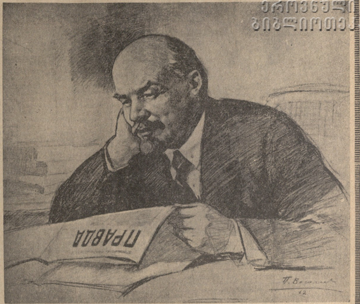
3. ი. ლენინი მხატვარი პ. ვასილიძე, ნახტი შესრულებულია სპეციალურად გაზეთ „კომუნისტი“-ში ქვედაპირველ კაბინეტში