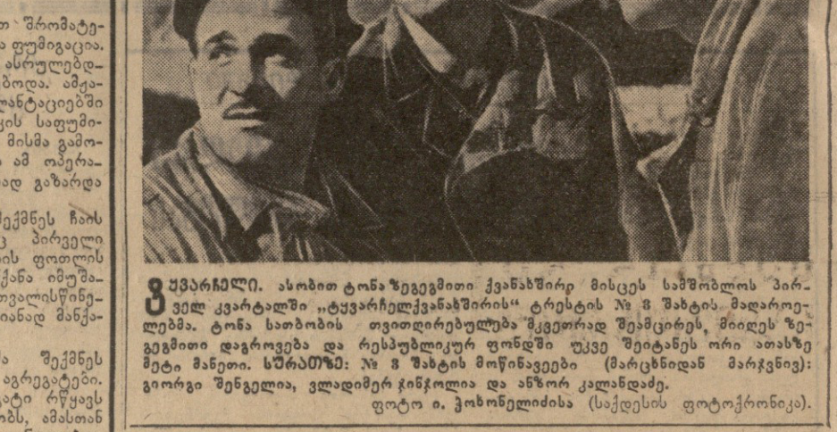
საპროპაგანდა... აკრძალული ცხოვრება...