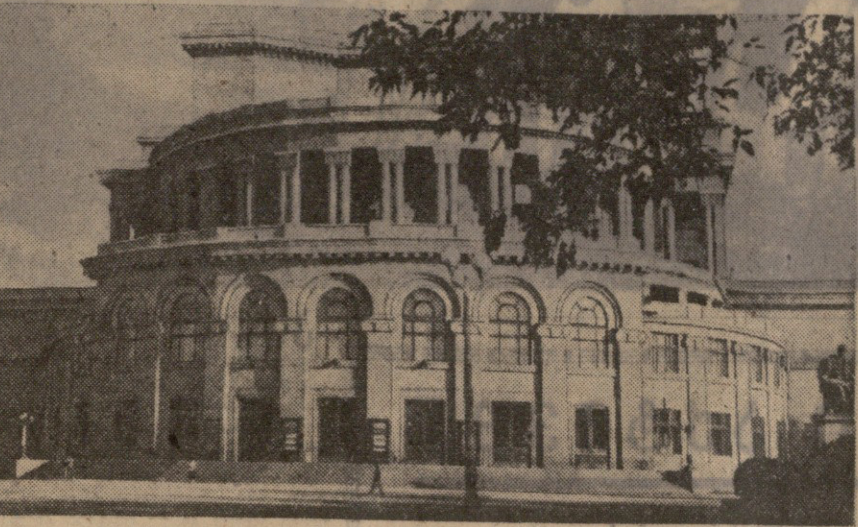
ერეკლის ალ. სანდორაძის სახელობის ბავშვთა და ბავშვთა ღირსი მდივანის სახელმწიფო პარტიული თეატრი.