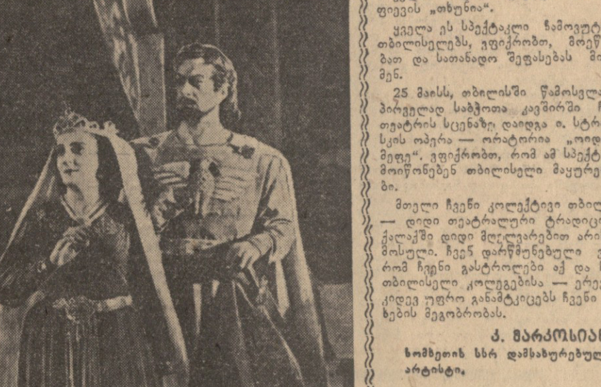
სომეხის სსრ დამსახურებული არტისტი.