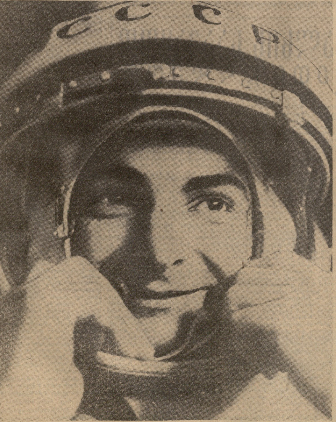
კოსმონავტი-სუთი 3. თ. ბიკოვსკი საუბანდრით.

მეორე შემოვლის დროს 16 საათსა და 36 წუთზე მოსკოვის დროით კოსმონავტი — ხუთმა ვ. თ. ბიკოვსკიმ ვეცნობა, თუ როგორ მიმდინარეობს ფრენა: მოსკოვი, კრემლი. მოგახსენებ საბჭოთა კავშირის კომუნისტური პარტიის ცენტრალურ კომიტეტს, საბჭოთა მთავრობას და პირადად ნიკიტა სერგის-ძე ბრუშოვს: თავს ჩინებულად ვგრძნობ, ხომალდის სისტემები ნორმალურად მუშაობენ, ფრენა წარმატებით მიმდინარეობს. მაღლობას ვუძღვნი საბჭოთა ხალხს, მშობლიურ პარტიასა და მთავრობას ნდობისათვის. (საქდესი).