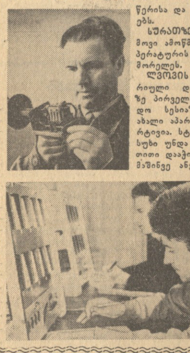
წერის და რედაქციის მუშაობის დროს...