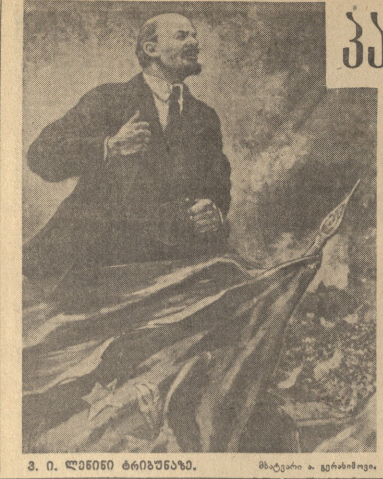
3. 0. ლენინი ტრიბუნაზე