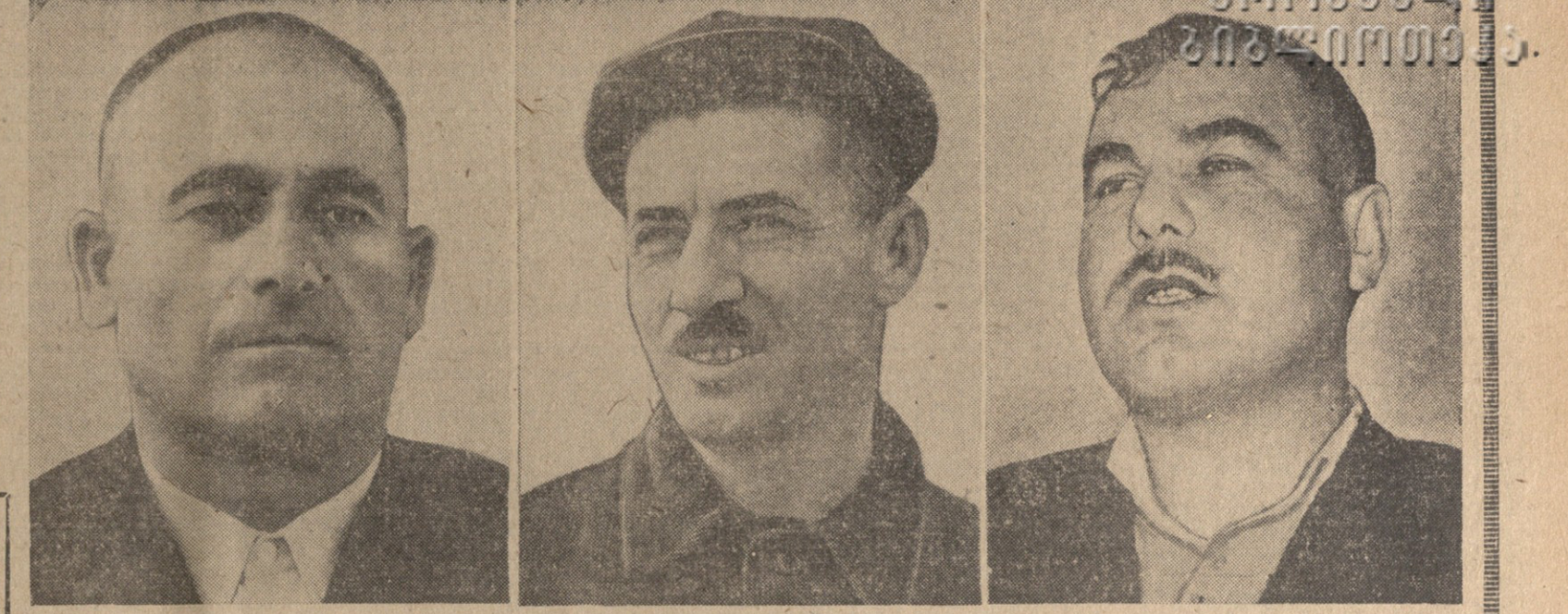
მიხეილ მთავრის მეთაურობითი მუშაობის მხარეში მყოფი მკვანიატორები

პირველი მკვანიატორები გულთა ახარება და შე-