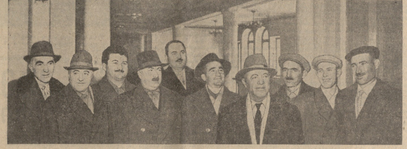
სსრკ ცენტრალური კომიტეტის წევრების და სსრკ საპრობლემის ორგანოს წევრების შეხვედრა...