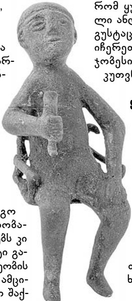
თამადა. ჩ3.6 VII-VI სს-ში პანში სსმორჩინილი ყანომობარ-ჯევაბული თამაღის ბრინჯაოს ქანდაკება