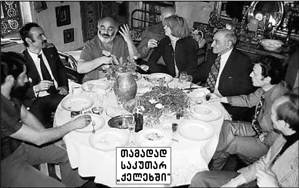
თამადალ საქუთარ ქელახში