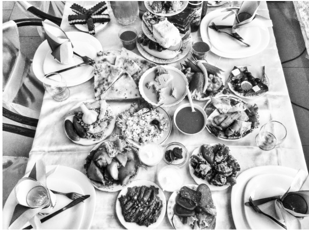
К примеру, в новый путеводитель аджарской кухни вошли такие блюда, как сирвали, мотриела, чинчрибухи, пестил-

Что касается нового путеводителя, то в него вошли малоизвестные и забытые аджарские блюда, десерты и закуски, а также различные кулинарные традиции. Исследование, проведенное во время кулинарной экспедиции, выявило такие блюда и десерты, о которых не знали даже местные жители.