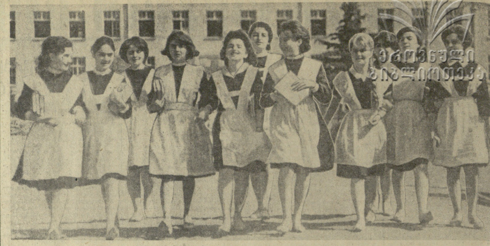
პიონერული ზაფხულის მონაწილეები. მშვენიერად დაიწყო პიონერული ზაფხული.

ნების, 5.000-ით მეტი, ვიდრე გასულ წელს. ზაფხულისთვის პიონერული ზაფხული დაიწყო. მშვენიერად დაიწყო პიონერული ზაფხული.