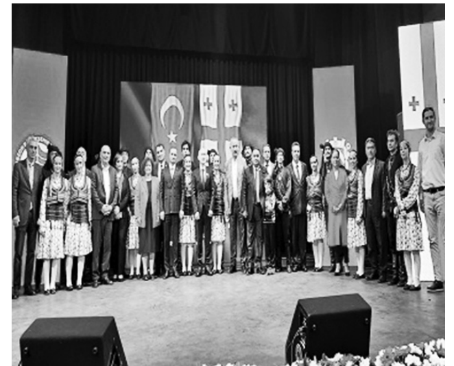
Страницу подготовила Ирина БУРКАДЗЕ.

"Дни Батуми" в Трабзоне завершились культурными мероприятиями, в которых приняли участие Государственный хореографический ансамбль Энвера Хабазде "Батуми" и Аджарский государственный вокальный ансамбль "Батуми".