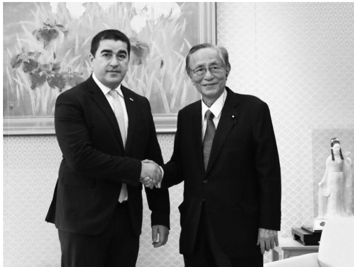
кавада, темой встречи были безопасность и бизнес.

По его словам, второй вопрос касается экономических отношений, и он отметил, что в плане сотрудничества с Грузией Япония очень заинтересована в возобновляемых источниках энергии. По словам Папуашвили, в этом плане японские компании уже сотрудничают с Грузией. Как заявил после встречи председатель комитета по иностранным делам Палаты представителей Японии Хитоши Кикава, темой встречи были безопасность и бизнес.