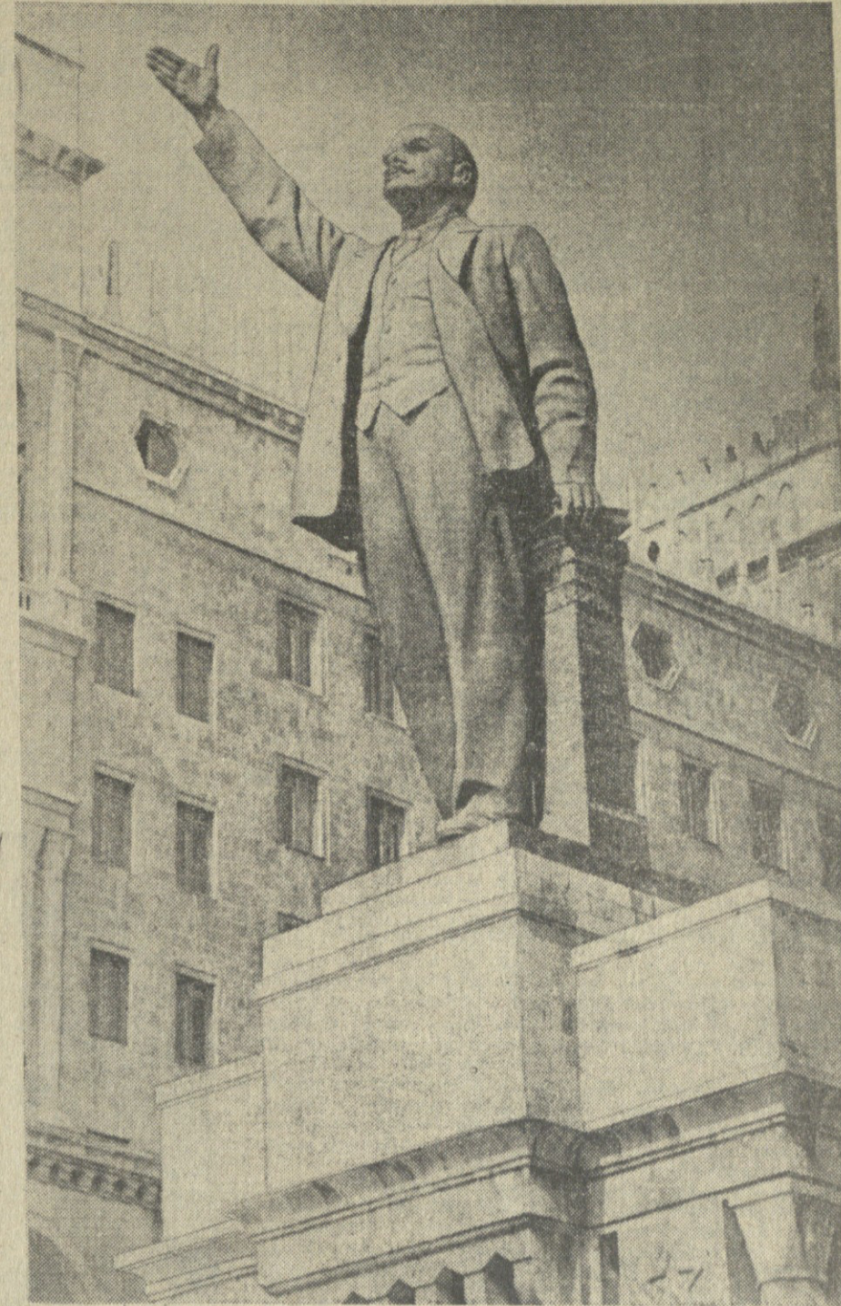
ბ. ა. კ. ი. ლენინის მონუმენტი აჭრბაიჯანის სსრ მთავრობის სასახლის წინ.

სახკომსაბჭოს თავმჯდომარე ვ. ულიანოვი (ლენინი)