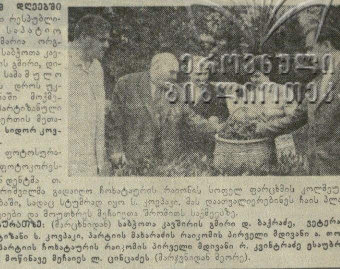
ეს ფოტოგრაფია ფოტოგრაფის მიერ გადაღებულია...