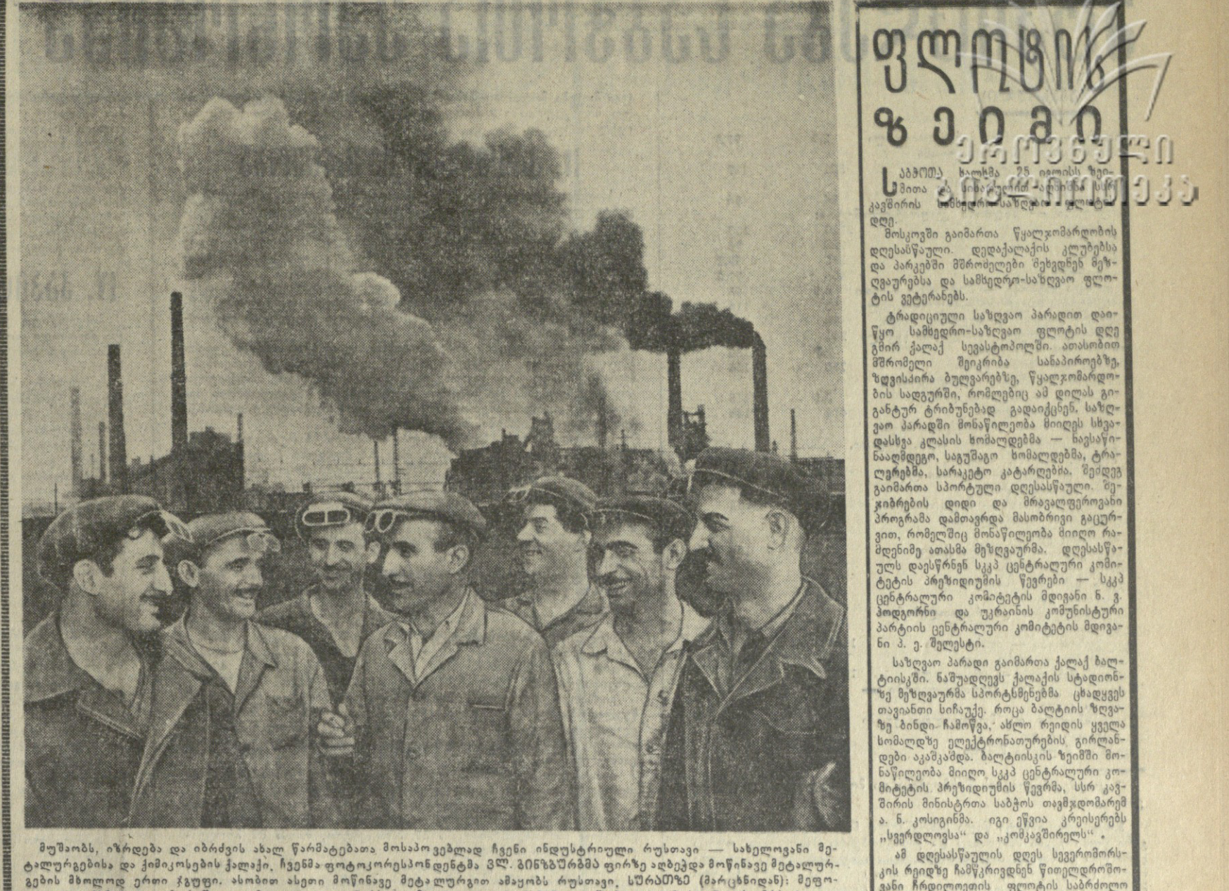
მუშაობს, იზრდება და იბრძვის ახალ წარმატებათა მოსაპოვებლად ჩვენი ინდუსტრიული რუსთავი — სახელგანთქმელი მუშაკებისა და ქიმიკების ქალები, ჩვენს ფორტოპრესსონდენტმა მ. მინაშვილმა ფირზე აღებდა მოწინავე მუშაკურთხევის მთავარი პრინციპების წყევლები — სკკ ცენტრალური კომიტეტის მდივანი მ. მინაშვილი და უმაღლესი საბჭოს მდივანი მ. მინაშვილი.