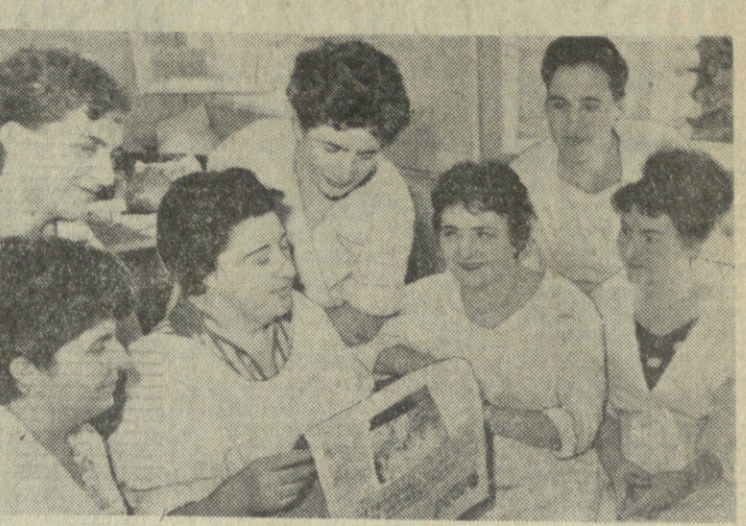
რის, რუმინეთის სახალხო რესპუბლიკის მინისტრთა საბჭოს თავმჯდომარის... (Caption describes the photo)