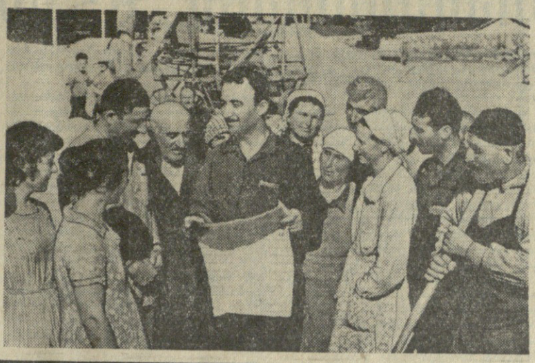
რის, რუმინეთის სახალხო რესპუბლიკის მინისტრთა საბჭოს თავმჯდომარის... (Caption describes the photo)

მორის ტორევი მუდამ იღვას იმპერიალისტური ფრენისა და... (Text continues with the memorial notice)