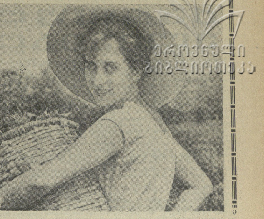
გვირი გვირი გვირი... გვირი გვირი გვირი...