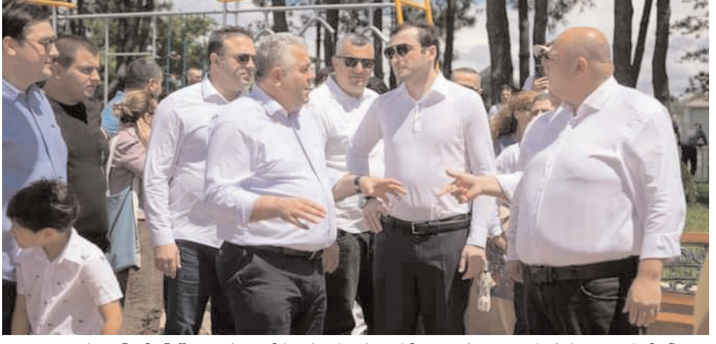
ადო ყველას, ვინც მონაწილეობდა ამ სივრცის შექმნაში, პირველ რიგში - ინფრასტრუქტურის სამინისტროს, - განაცხადა თორნიკე რიჟვაძემ.

24 ივლისს ქობულეთის მუნიციპალიტეტში ახალი ბულვარი საზეიმო ვითარებაში გაიხსნა. ცერემონიას აჭარის მთავრობის თავმჯდომარე თორნიკე რიჟვაძე, ქობულეთის მუნიციპალიტეტის მერი ლევან ზოიძე, საქართველოს მუნიციპალური სერვისების განვითარების ფონდის აღმასრულებელი დირექტორის პირველი მოადგილე გიორგი ცივაძე, სხვა ოფიციალური პირები დაესწრნენ. მათ ბულვარი დაათვალიერეს და აღვივებულ ჩატარებული სამუშაოებში შეაფასეს. აჭარის მთავრობის თავმჯდომარის თქმით, როგორც ტურისტული თვალსაზრისით, ასევე ეკონომიკურ ღირებულებას მნიშვნელოვანია ახალი რეკრეაციული, გასართობი და გამაჯანსაღებელი სივრცეების მოწყობა. - თქვენ ხედავთ, რამდენი ადამიანი შეკრებილი ახალ ზღვისპირა პარკში. პრემიერ-მინისტრის ინიციატივით განხორციელდა „განახლებული რეგიონების“ ერთ-ერთი მნიშვნელოვანი პროექტი. ტერიტორია აქ მცხოვრებლებსთვის და ტურისტებისთვის ერთ-ერთი საყვარელი ადგილი გახდება. ეკონომიკისთვისაც მნიშვნელოვანია ამ ახალი ინფრასტრუქტურის შექმნა, ეს გაუხსნის ახალ შესაძლებლობებს ბიზნესს. დიდი მადლობა მინდა გადავუხადო ყველას, ვინც მონაწილეობდა ამ სივრცის შექმნაში, პირველ რიგში - ინფრასტრუქტურის სამინისტროს, - განაცხადა თორნიკე რიჟვაძემ. - ახალი ბულვარი მდინარე აჭყვიდან მდინარე კინტიშამდე გაგრძელდა. მთელ სიგრძეზე აშენდა გამყოფი კედელი, ასევე 2,5 მეტრი სიგანის ველობილიკი და 4 მეტრი სიგანის