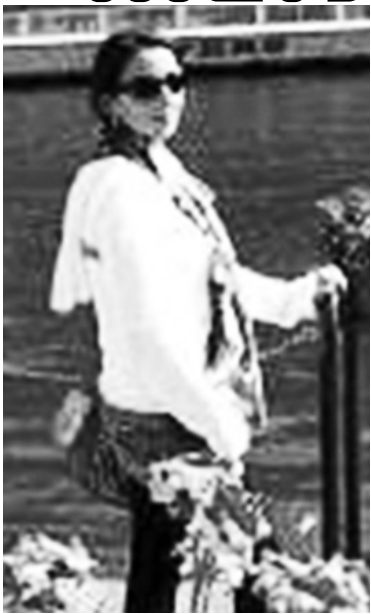
ერთ რამეში - რამდენადაც მისცემ შენ თავს განვითარების უფლებასა და საშუალებას, მით უფრო მეტი გზა გაგვხსნება.

- ამბობენ, რომ თუ ადამიანი რაიმეს გულთბილი მოინდობს, აუცილებლად აიხდენსო. მეც მჯერა ამის და ჩემ გარშემო ადამიანები კიდევ უფრო მაჩვენებენ, რომ ცხოვრებაში ყველაფერი შესაძლებელია, მთავარია, მოინდომო, - ამბობს ჩემი რესპონდენტი და იმ ცხოვრებაზე მივყვება, რომელიც მისივე აღმოჩენილმა ახალმა სამყარომ მთლიანად შეუცვალა და გაულამაზა. ახლა თავდაც სხვების გზამკვლევადაა იქცა.