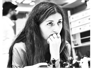
ლოს პრემიერ-მინისტრმა ირაკლი ღარიბაშვილმა:

ქართველ მოჭადრაკე ქალებს წარმატება მიულოცა საქართვე-