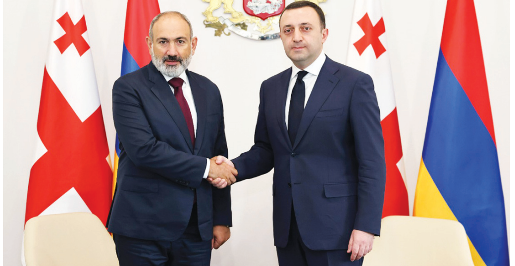
ირაკლი ღარიბაშვილმა და ნიკოლ ფაშინიანმა ერევანში არსებულ ვითარებაზე ისაუბრეს.

საქართველოს პრემიერ-მინისტრი ირაკლი ღარიბაშვილი სომხეთის რესპუბლიკის პრემიერ-მინისტრს ნიკოლ ფაშინიანს შეხვდა პირისპირ შეხვედრაზე საქართველოსა და სომხეთის რესპუბლიკის პრემიერ-მინისტრებმა ორ ქვეყანას შორის არსებული თანამშრომლობის დღის წესრიგის ძირითადი საკითხები მიმოიხილეს. საუბარი შეეხო საქართველოს და სომხეთის რესპუბლიკას შორის არსებულ თანამშრომლობას სავაჭრო-ეკონომიკურ, სატრანსპორტო, ლოგისტიკისა და კულტურის სფეროში. ხაზი გაესვა არსებული მჭიდრო პარტნიორული და მეგობრული ურთიერთობების კიდევ უფრო გაღრმავების მნიშვნელობას. ირაკლი ღარიბაშვილმა ნიკოლ ფაშინიანს ერევანში მომხდარი ტრადიციული გამო მისამართა. შეხვედრაზე ასევე აღინიშნა საქართველოს მნიშვნელოვანი როლი და ძალისხმევა რეგიონში მშვიდობისა და სტაბილურობის ხელშეწყობაში, მათ შორის, თბილისში გამართული სომხეთ-ისა და აზერბაიჯანის რესპუბლიკების საგარეო საქმეთა მინისტრების შეხვედრა.