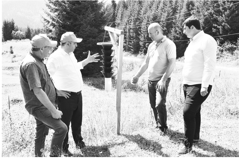
ბლომის პრევენცია და სხვა.

ჩირუხის მეტყვევის სახლი გარემოს დაცვისა და ბუნებრივი რესურსების სამმართველოს სსიპ „აჭარის სატექნიკო სააგენტოს“ ქვეპროგრამის „სატექნიკო სამეურნეო ინფრასტრუქტურის გამართვა“ - ფარგლებში აშენდა. მისი ძირითადი დანიშნულებაა ტყის რესურსებზე მოსახლეობის სოციალური მოთხოვნების დროული დაკმაყოფილება დასახლებული პუნქტებიდან დაშორებულ უბნებში, განსაკუთრებით - ადრე გაზაფხულზე და გვიან შემოდგომაზე, ასევე, ტყის უკანონო სარგე-