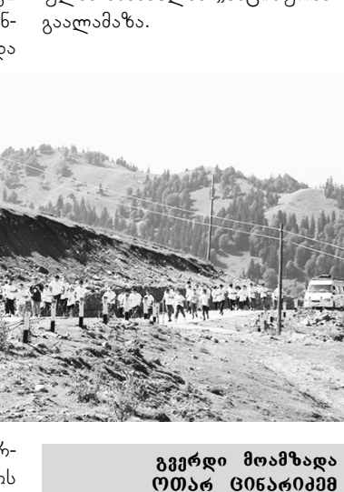
გვერდი მოამზადა ოთარ ცინაბიძემ

ის», აჭარის ავტონომიური რესპუბლიკის საზოგადოებრივი ჯანდაცვის ცენტრისა და «საინფორმაციო ცენტრი ნატოსა და კულტურის ცენტრთან არსებულმა ანსამბლმა «საციხურმა» გაალაშა. ევროკავშირის შესახებ მხარდაჭერით ჩატარდა, ხულოს