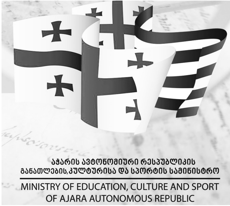
აჭარის ავტონომიური რესპუბლიკის განათლების, კულტურისა და სპორტის სამინისტრო MINISTRY OF EDUCATION, CULTURE AND SPORT OF AJARA AUTONOMOUS REPUBLIC

„დოკუმენტური ან/და მხატვრულ-დოკუმენტური ფილმების საგარანტო კონკურსი“ მონაწილეობის უფლება აქვს საქართველოში რეგისტრირებულ არასამეწარმეო (არაკომერციული) იურიდიულ პირს, გარდა სახელმწიფოს ბიუჯეტის, აჭარის ავტონომიური რესპუბლიკის ბიუჯეტის ან მუნიციპალურ დაფინანსებაზე მყოფი ორგანიზაციისა.