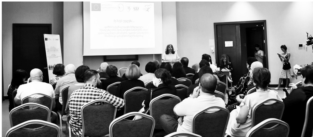
„მე მაქვს უფლება...“ კონფერენციის ფინანსური მხარდაჭერით. აჭარის რეგიონში კი პროექტს ახორციელებს ბათუმის განათლების განვითარების და დასაქმების ცენტრი.

ღონისძიება გაიმართა პროექტის „სამოქალაქო საზოგადოება შეზღუდული შესაძლებლობის მქონე პირთა უფლებებისთვის საქართველოში“ ფარგლებში, რომელსაც ახორციელებენ „ცვლილებები თანაბარი უფლებებისთვის“ და „კალიცია დამოუკიდებელი ცხოვრებისათვის“.