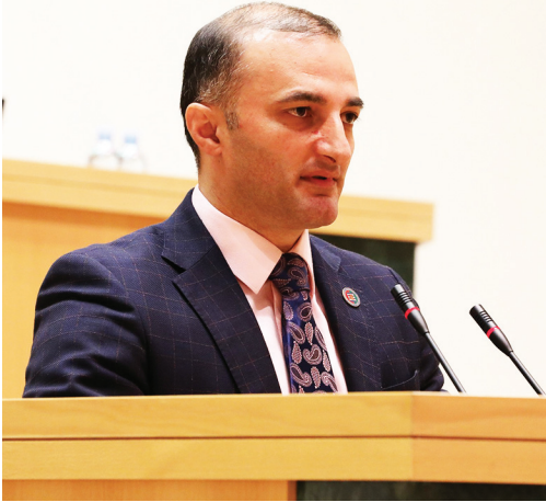
საკანონმდებლო პაკეტი პლენარულ სხდომაზე მისმა ერთ-ერთმა ავტორმა - აჭარის უმაღლესი საბჭოს თავმჯდომარე დავით გაბაიძემ წარადგინა. მცირედი განმარტების შემდეგ, მან საქართველოს პარლამენტის წევრებს, წამყვან კომიტეტსა და აპარატის თანამშრომლებს თანამშრომლობისა და მხარდაჭერისათვის მადლობა გადაუხადა.

აჭარის უმაღლესი საბჭოს მიერ ინიცირებული საკანონმდებლო ინიციატივა „მაჭახელას და ცუული ლანდშაფტის შექმნისა და მართვის შესახებ“ და „საქართველოს ადმინისტრაციულ სამართალდარღვევათა კოდექსში ცვლილების შეტანის შესახებ“, საქართველოს პარლამენტმა მესამე მოსმენით, 85 ხმით მიიღო. წინააღმდეგი არავინ წასულა. საკანონმდებლო პაკეტი მაჭახელას ხეობის ბიომრავალფეროვნებით, ისტორიული და კულტურული თვალსაზრისით გამორჩეული ტერიტორიების დაცვას, აღდგენასა და გონივრული გამოყენების ხელშეწყობას ითვალისწინებს. საქართველოს პარლამენტმა უმნიშვნელოვანესი გადაწყვეტილება მიიღო, რაც უახლოეს მომავალში ისტორიული ხეობისა და მისი მცხოვრებლების სოციალურ-ეკონომიკურ მდგომარეობაზე სასიკეთოდ აისახება.