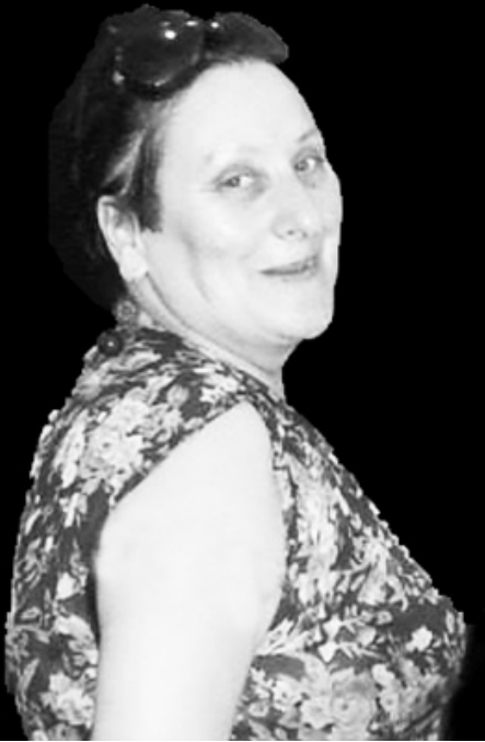
კარა წყარო მზის სხივებს. ყოველთვის ნაღ და სათუთი პოეტური სახეებით მდიდარ მის სტრიქონებს აქვთ საოცარი ძალა და ვფიქ-