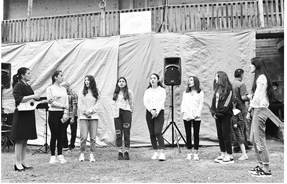
მოილოცა, წირვა სხალთის ეპარქიის მღვდელმსახურებმა ადავლინეს. იმ დღეს მართლმადიდებ-

«დარჩიქებობა» ღვიწმწმობლობას დაამთავრეს. ათეულობით ზეიმის მონაწილემ ტაძარში