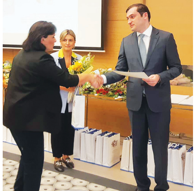
მერი არჩილ ჩიქოვანი და სხვადასხვა უწყების ხელმძღვანელები დაესწრნენ.

გვითხრა ზემო ვაშლივანის საჯარო სკოლის ქართული ენისა და ლიტერატურის მასწავლებელმა მანანა ქამადაძემ. მასწავლებლებს პროფესიული დღე მიულოცა აჭარის განათლების, კულტურისა და სპორტის მინისტრმა მათა ხაჩიშვილმა: - დიდი პატივისცემითა და მადლიერებით გრძნობთ მინდა მივულოცო მასწავლებელთა საერთაშორისო დღე თითოეულ იმ ადამიანს, ვინც დღეს პედაგოგიურ საქმიანობაშია ჩართული, ასევე მათ, ვინც დატოვა განათლების სფერო, მაგრამ წლების განმავლობაში ემსახურებოდა და გაზარდა არაერთი თაობა. ამავდროულად, მინდა ვთქვა, რომ დიდი სიამოვნებით მივიღებთ ჩვენს სისტემაში ახალგაზრდა კადრებს იმისთვის, რომ არ გაწყდეს თაობათა შორის კავშირი და ის გამოცდილება, რაც არის დაგროვებული, გადაეცეს ახალ თაობებს. მინდა თითოეულ პედაგოგს, უპირველეს ყოვლისა, ჯანმრთელობა ვუსურვო, ასევე, ბევრი წარმატება და მადლიერი თაობები. საზეიმო დაჯილდოებას აჭარის მთავრობის თავმჯდომარე თორნიკე რიჟვაძე, უმაღლესი საბჭოს თავმჯდომარე დავით გაბაიძე, ბათუმის