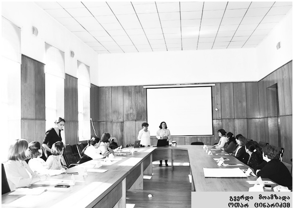
გვერდი მთავარად ოთახ ცინარიმში

პროექტში მონაწილეობის მსურველებმა სპეციალური აპლიკაციის ფორმები შეავსეს. ჩატარდა სამი საინფორმაციო შეხვედრა/სწავლება შემდეგ თემებზე: დეკრეტიული შევბულების ანაზღაურებასთან დაკავშირებული გამოწვევები და რეაგირების გზები, დედათა და ბავშვთა უფლებები, შევბულების ხანგრძლივობა, შევბულების გაცემის წესი და შევბულების თავისებურებანი სხვადასხვა სიტუაციაში; გენდერული უთანასწორობა შრომით ბაზარზე; აუნაზღაურებელი შრომა და ზრუნვის ეკონომიკა; შრომაში არსებული პრობლემების გამოვლენა/რეაგირება; ადვოკატირების მექანიზმები შუამდობის ქალებისთვის, შუამდობის მართლმართლად დედებისთვის.