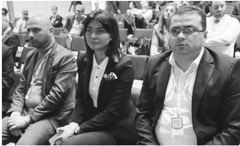
ფორუმში ჩეხეთის რესპუბლიკის მრეწველობისა და ვაჭრობის მინისტრისა და ევროკომისიის ორი განიხილეს მონაწილეობისა და ვაჭრობის საგანზე გაიმართა.

ფორუმში მონაწილეობდა საქართველოს ეკონომიკისა და მდგრადი განვითარების მინისტრი, ვიცე-პრემიერი ლევან დავითაშვილი, რომელმაც ისაუბრა საქართველოსთვის ევროკავშირთან პოლიტიკური ასოცირებისა და ეკონომიკური ინტეგრაციის მნიშვნელობაზე და იმ რეგულაციების ფართო სპექტრზე, რომლებიც მიზნად ისახავს არა მხოლოდ ევროკავშირთან სავაჭრო ურთიერთობების გაღრმავებას, არამედ ევროკავშირის სტანდარტებთან დაახლოების ხელშეწყობას სხვადასხვა სფეროში.