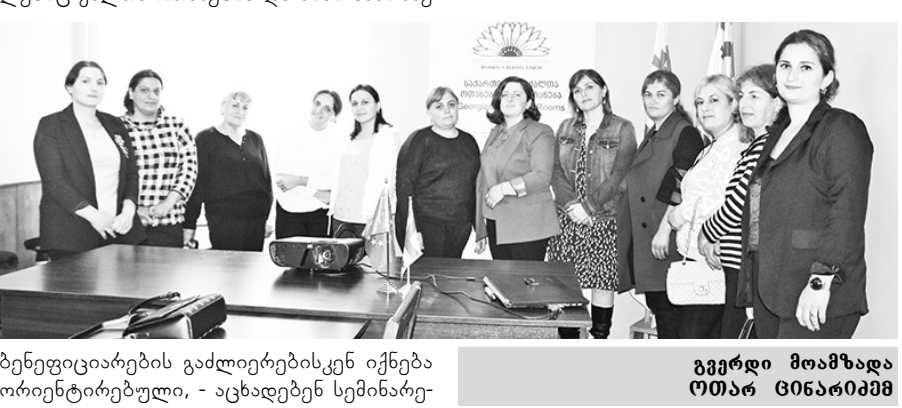
ბენეფიციარების გაძლიერებისკენ იქნება ორიენტირებული, - აცხადებენ სემინარის- გვერდი მოამზადა ლიანა ცინცაძემ

ბის ორგანიზატორები. სადისკუსიო პლატფორმის წევრები პერიფერიულ სოფლებში შეხვედრებს გამართავენ.