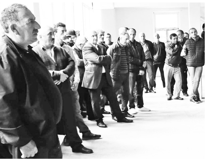
ილზე გაცნობა და მოგვარების გზებზე ერთობლივი მსჯელობა.

ქედის მუნიციპალიტეტის მერი როლანდ ბერიძე, აჭარის სოფლის მეურნეობის მინისტრის მოადგილე მირიან ქათამაძე, აჭარის სოფლის მეურნეობის სამინისტროს წარმომადგენლები და საკრებულოს თავმჯდომარე ამირან ცინცაძე აჭარის მთავრობის თავმჯდომარის ინიციატივით სოფლად მოსახლეობასთან შეხვედრების ფარგლებში წინიარისის ადმინისტრაციული ერთეულის მოსახლეობას შეხვდა. შეხვედრაზე სამინისტროს წარმომადგენლებმა მოსახლეობას სამინისტროს პროგრამების, პროექტებისა და დაგეგმილი სი-ახლეობის შესახებ მიაწოდეს ინფორმაცია. ადგილზე მოისმინეს სოფლის პრობლემები და შესაბამისი უწყებების ჩართულობით იმსჯელეს მათი მოგვარების გზებზე. ქედში აჭარის მთავრობის თავმჯდომარე თორნიკე რიჟვაძის ინიციატივით სოფლად მცხოვრებ მოსახლეობასთან შეხვედრები კვლავ გაგრძელდება, რომლის მიზანია მათი საჭიროებების ად-