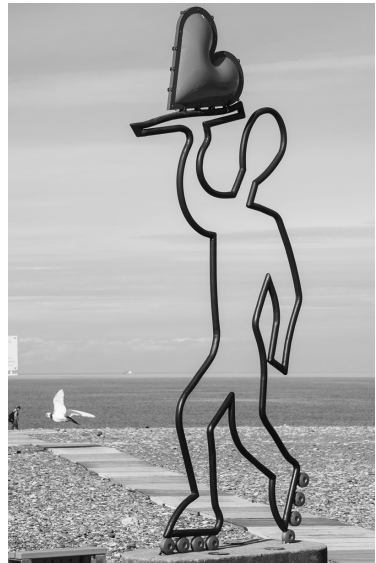
შევენებს ბულვარის ზღვისპირა ზოლს და დიდ მოწონებას იმსახურებს

„მოქანდაკე გელა ნულაძე გაცივდა ბათუმის ბულვარში არსებული რამდენიმე საავტორო ქანდაკების ავტორი, რომლებიც ბულვარის სიმბოლო და ერთგვარი სავიზიტო ბარათია. გელა ნულაძის „სიყვარულის სერიად“ წოდებული რამდენიმე თანამედროვე სკულპტურა, როგორცაა: „გარიაცი სიყვარულზე 1“; „გარიაცი სიყვარულზე 2“; „გარიაცი სიყვარულზე 3“; „ყირამალა“ უკვე ათწლეულებია მტკიცად