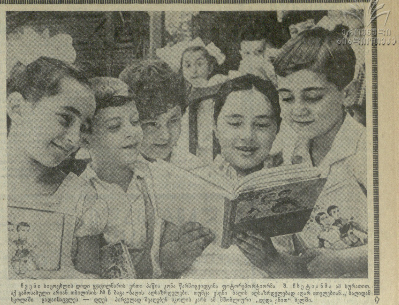
ჩვენს სკოლებში დიდი ყვავილანის ერთი მაკია კონა წარმოგვიდგინა ფოტოგრაფიკორმა...