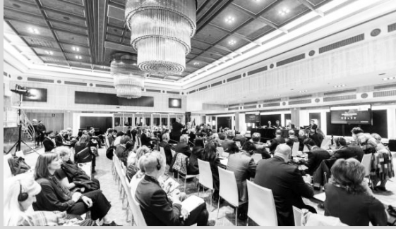
ამიტომ უკრაინის გაწევრიანება ალიანსისთვის სასურველი და მნიშვნელოვანია.

ჩერნემის თქმით, დელეგატებმა ხაზი გაუსვეს, რომ უკრაინის არმია ცალსახად გააძლიერებს ნატოს,