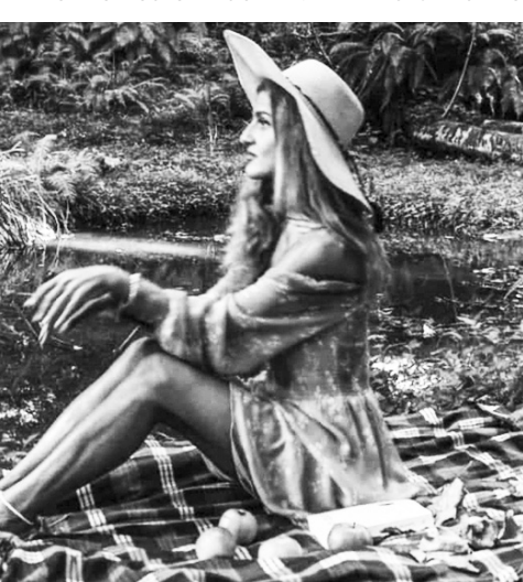
ლი. პირველ რიგში, უნდა ირწმუნო, რომ შეუძლებელი არაფერია და თავდაუზოგავ შრომას აუცილებლად მოჰყვება შედეგი. არ დაელოდოთ ხვალს, დაიწყეთ დღეიდან შევსებით, ოღონდ მხოლოდ და მხოლოდ საკუთარ თავთან და დამიჯრეთ, სულ მალე თქვენ გახდებით იმაზე უკეთესი, ვიდრე იყავით.

გამოუვათ, მაგრამ თუ საქმე დროს სწორ ადგილას და ადამიანთან მოხვდება, სულ მალე იტყვი - დიახ, ეს მე ვარ, დიახ, ეს მე შეიძ