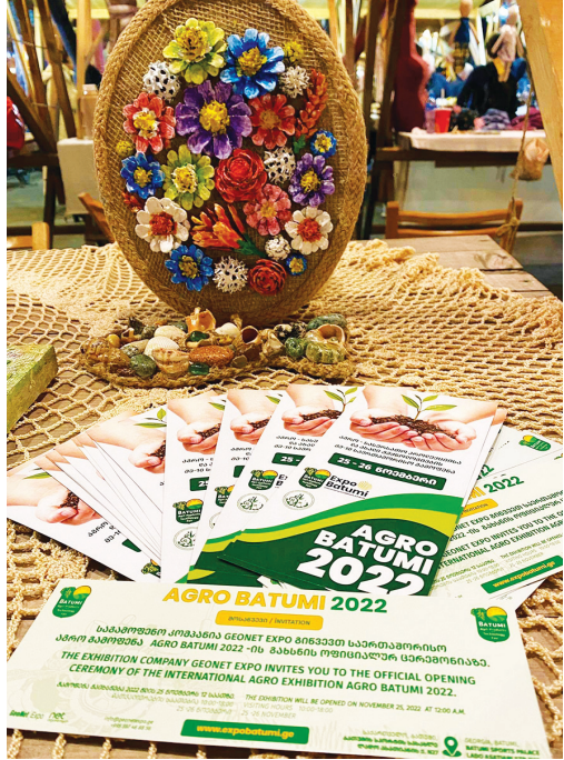
გამოფენის ფარგლებში გაიმართება საერთაშორისო კონფერენცია, B2B შეხვედრები და მასტერკლასები.

გამოფენის ფარგლებში გაიმართება საერთაშორისო კონფერენცია, B2B შეხვედრები და მასტერკლასები. გამოფენაში მონაწილეობენ შემდეგი პროფილის კომპანიები: სასოფლო-სამეურნეო ტექნიკა და ინვენტარი, სასუქები და მცენარეთა დაცვის საშუალებები, სასათბურე მეურნეობისა და სათბურის აღჭურვილობა, მეტეოროლოგიური საზომი და მელორაციის სისტემები, ალკოჰოლური და უალკოჰოლო სასმელები, მწარმოებლები, რძის პროდუქტების მწარმოებელი კომპანიები, ჯემების და მურაბების მწარმოებელი კომპანიები, მეფრინველეობა, მეცხოველეობა, შესაფუთი მასალები და სოფლის მეურნეობასთან დაკავშირებული ორგანიზაციები. გამოფენის ოფიციალური გახსნის ცერემონიას დასრულებს აჭარის მთავრობის დიპლომატიური კორპუსის, არასამთავრობო ორგანიზაციებისა და მასმედიის წარმომადგენლები. მხარდაჭერები არიან: აჭარის მთავრობა, ბათუმის მერია, აჭარის სოფლის მეურნეობის სამინისტრო, აჭარის სოფლის მეურნეობის სამინისტროს (ა)იპ „აგროსერვის ცენტრი“, „წარმოე საქართველოში“, საქართველოს სავაჭრო-სამრეწველო პალატა, აჭარის სავაჭრო-სამრეწველო პალატა, საქართველოს საერთაშორისო ინვესტიციის ასოციაცია (IIA), თურქ ბიზნესმენთა ასოციაცია (MUSIAD), ქართველ და თურქ ბიზნესმენთა ასოციაცია (GURTIAD), აჭარის ტელევიზია, TV 25 და გაზეთი „აჭარა“.