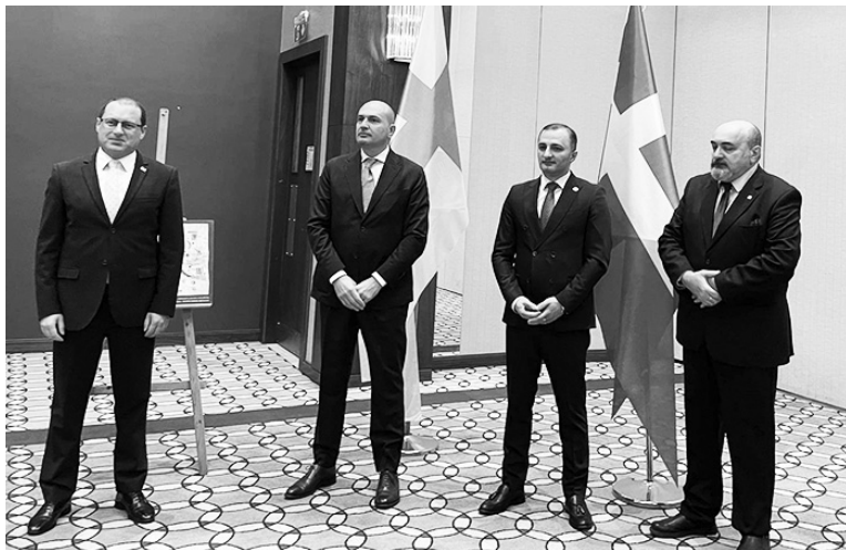
სახელმწიფო საბჭომ შეიმუშავა.

შეხვედრა საქართველოს პარლამენტთან არსებული ჰერალდიკის სახელმწიფო საბჭოს ორგანიზებით ჩატარდა, რომელსაც აფხაზეთისა და აჭარის ავტონომიური რესპუბლიკების საკანონმდებლო და აღმასრულებელი ხელისუფლების წარმომადგენლები, ჰერალდიკის, გეგმათა და სიმბოლოების კვლევის ცენტრის წევრები, სამეცნიერო წრეებისა და საზოგადოებრივი ორგანიზაციების წარმომადგენლები ესწრებოდნენ.