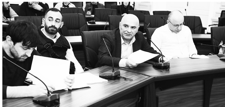
რობის მიერ დასახული პრიორიტეტების და ბათუმში არსებული სიტუაციის ანალიზის გათვალისწინებით ჩამოყალიბდა.

პრიორიტეტების დოკუმენტის მიხედვით, განათლება, კულტურა, ახალგაზრდობის ხელშეწყობა და სპორტი ერთ-ერთ პრიორიტეტულ მიმართულებას წარმოადგენს იმ სფეროებს შორის, რომლებიც საქართველოს მთავრობისა და აჭარის ავტონომიური რესპუბლიკის მთავრობის მიერ დასახული პრიორიტეტების და ბათუმში არსებული სიტუაციის ანალიზის გათვალისწინებით ჩამოყალიბდა.