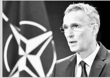
ინსტიტუტები, რომლებსაც სარგებელი მოაქვს ყველა ჩვენგანისთვის“, - განაცხადა სტოლტენბერგმა.

ლა თანამოაზრე ქვეყანასთან მსოფლიოში: ლათინური ამერიკიდან - ახლო აღმოსავლეთამდე, ჩრდილოეთ აფრიკიდან - ინდო-წყნარი ოკეანეთის რეგიონამდე. ჩვენ ვიზიარებთ უსაფრთხოების ინტერესებს და ერთსა და იმავე გამოწვევების წინაშე ვდგავართ. ჩვენ შეგვიძლია და უნდა გავუმკლავდეთ მათ ერთად, რათა დავიცვათ თავისუფლება ზეწოლის საწინააღმდეგოდ, დავიცვათ დემოკრატია ტირანიის საწინააღმდეგოდ და დავიცვათ საერთაშორისო წესებზე დაფუძნებული