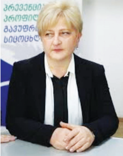
მება H3N2 ე.წ. „ჰონკონგვირუსი“, რომელიც ახალი ვირუსი არ არის.

- წლებგანდელი წელი გასულ წლებთან შედარებით გამოირჩევა იმ თვალსაზრისით, რომ დომინირებს ტიპის ვირუსი, რომელშიც იგულისხმება