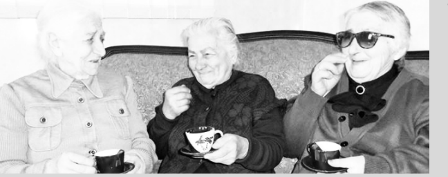
ცემები, როგორებიცაა დღის ცენტრები და 60+ კლუბები.

გეროს მოსახლეობის ფონდის (UNFPA) კვლევის „მარტოობა ხანდაზმულებში“ ანალიტიკური ანგარიშის პრეზენტაცია გეროს მოსახლეობის ფონდის საქართველოს ოფისის ინიციატივით გაიმართა