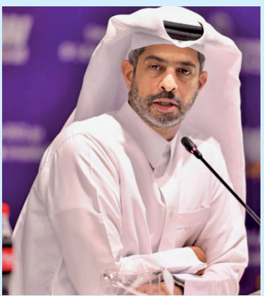
ამ უცნაურია, თუ რაზე გსურთ ფოკუსირება თქვენს პირველივე კითხვაში. სიკვდილი ცხოვრების განუყოფელი ნაწილია. ეს შესაძლოა სასახურშიც მოხდეს, ძილშიც. მუშათა სიკვდილი 2022 წლის მსოფლიო ჩემპიონატის მიმდინარეობისას დიდი განხილვის თემაა. ყველაფერი, რაც ითქვა, აბსოლუტური სიცრუეა! ჩვენ ცოტა იმედგაცრუებული ვართ, რომ ყურნალისტები ამბავებზე ამ ცრუ ნარატივს ვფიქრობ, ბევრმა ყურნალისტმა უნდა ჰკითხოს საკუთარ თავს და დაფიქრდეს, თუ რატომ ცდილობდნენ ამდენი ხნის განმავლობაში ამ თემის გაშუქებას, - თქვა ალ-ხატერმა.

ნ დეკემბერს კატარში ფილიპინელი მუშა საუდის არაბეთის საწვრთნელ ბაზაზე, რესტრავარაციის დროს, პანდუსიდან გადავიდა, სატვირთო მანქანას დაეცა და გარდაიცვალა. Reuters-ის ყურნალისტის პირველი კითხვაც 2022 წლის მუნდიალის საორგანიზაციო კომიტეტის თავმჯდომარე ნასერ ალ-ხატერისთან სწორედ ეს იყო, რაზეც მან მიუგო: