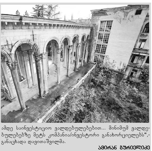
ამდენ საინვესტიციო ვალდებულებებში... მინიმუმ ვალდებულებებზე მეტს კომპანია/ინვესტორი განახორციელებს“- განაცხადა დავითაშვილმა.