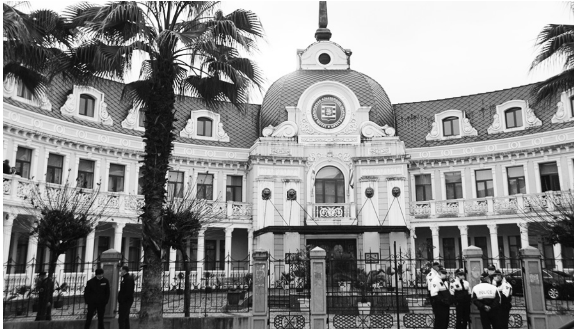
მიერ გამოქვეყნებულ შეფასებაში. საუბარია დადგენილებაზე, რომლის თანახმადაც, საგრძნობლად გაიზარდა საბჭოს მიერ პროაქტიულად გამოსაქვეყნებელი საჯარო ინფორმაციის ნუსხა.

ინფორმაციის თავისუფლების განვითარების ინსტიტუტმა (IDFI) ცალკეული უწყებების მიერ პროაქტიული გამჭვირვალობის უზრუნველყოფის მიზნით 2022 წელს განხორციელებული ღონისძიებების ტრადიციული მონიტორინგის შედეგები გამოაქვეყნა, რომელშიც, როგორც წინა წლებში, დადებითადაა შეფასებული აჭარის უმაღლესი საბჭოს საქმიანობა: „საჯარო ინფორმაციის პროაქტიული გამოქვეყნების თვალსაზრისით არსებული გამოწვევების ფონზე, დადებითად უნდა შეფასდეს 2022 წელს ცალკეული უწყებების მიერ პროაქტიული გამჭვირვალობის უზრუნველყოფის მიზნით გადადგმული ნაბიჯები. მაგალითად, აჭარის უმაღლესმა საბჭომ მიიღო ინფორმაციის პროაქტიული გამოქვეყნების მნიშვნელოვანი გაუმჯობესებელი დადგენილება და დაიწყო შესაბამისი საჯარო ინფორმაციის ვებგვერდზე გამოქვეყნება“, - ნათქვამია ინსტიტუტის