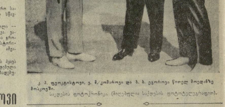
საკლესის ფოტოკონსილი. (მედიკალი საკლესის ფოტოკონსილი).

3. ა. კომაროვი სოფლის მემკვიდრე კოსმონავტი მამარბაძე და ვ. კომაროვი „ვარსკვლავთა ქალაქში“.