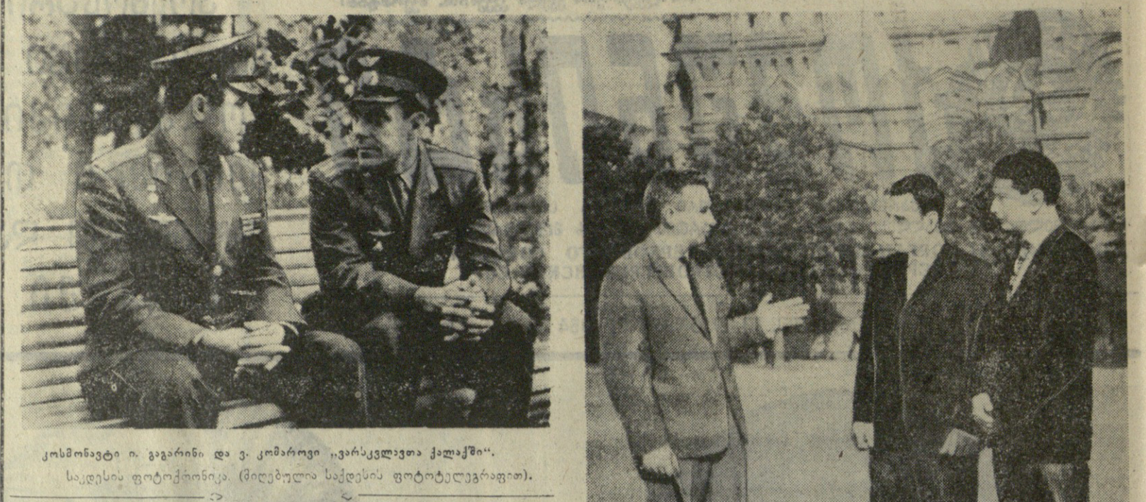
კოსმონავტი ი. გაგარინი და ვ. კომაროვი „ვარსკვლავთა ქალაქში“.

3. ა. კომაროვი სოფლის მემკვიდრე კოსმონავტი მამარბაძე და ვ. კომაროვი „ვარსკვლავთა ქალაქში“.