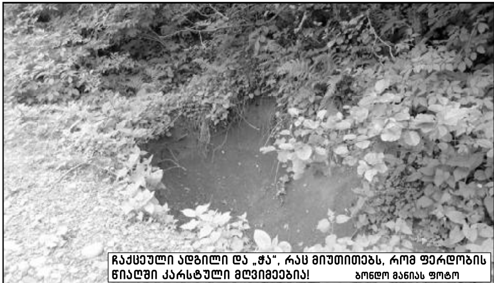
ჩაქსული ადგილი და „ჭა“, რას მიუთითებს, რომ ფერდობის წიაღი კარსტული მღვიმეებია! ზონდო მანია ჟოტო