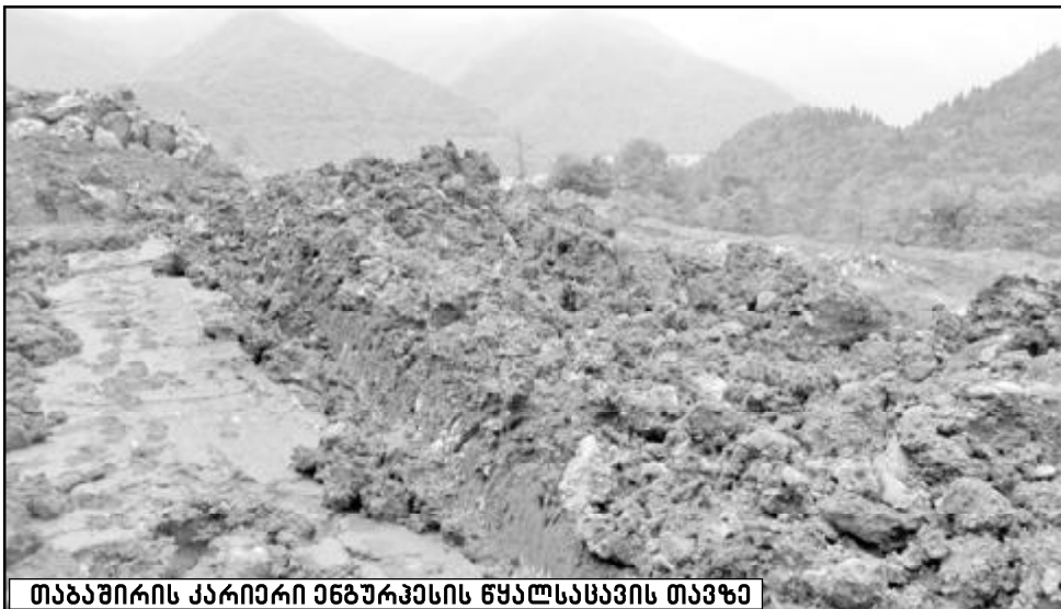
თბაშირის კარიერი ენგურჰესის წყალსაცავის თავზე